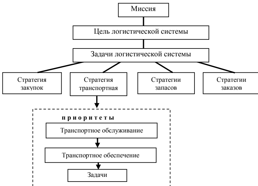
Рис.2 – Обобщенная структура логистической системы

Возникает вопрос, какие стратегии на производстве целесообразно совмещать с транспортными и со стратегиями управления запасами, для того чтобы минимизировать совокупные затраты логистической системы.