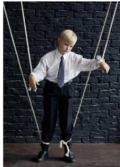
Рисунок 6 – Фото 2 – 5

Як, на вашу думку, будуть складатись взаємини між матір'ю та дорослою дитиною – з огляду на таку «материнську любов»?