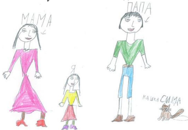
Рисунок 3 – Малюнок дитини 3

Завдання для самостійної роботи. Організувати у групах дітей старшого дошкільного віку малювання сім'ї. Зробити психологічний аналіз малюнку.