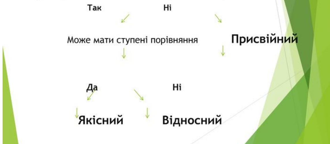
Рисунок 4 – Приклад програмованого навчання

Завдання 4. Ознайомтесь із методикою проблемного навчання (евристичний метод). Створіть низку сократівських питань до проблеми вибору автомобіля за ціною чи якістю (або до іншої проблемної теми)