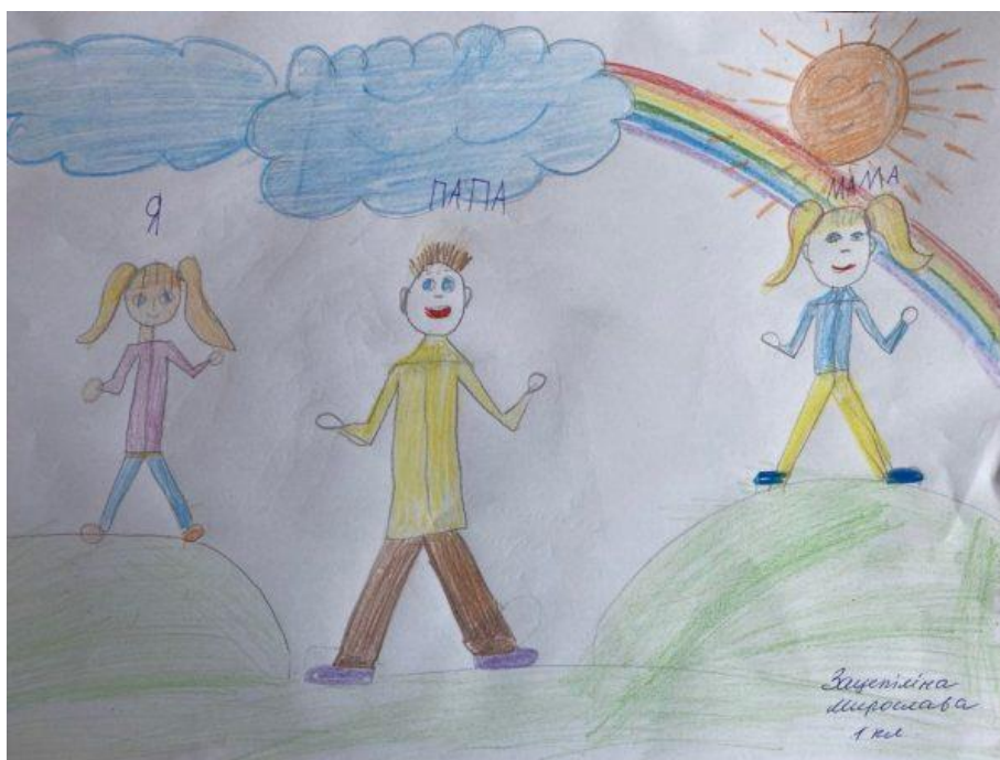
Рисунок 1 – Малюнок дитини 1

Завдання 3. Зробіть психологічний аналіз представлених нижче дитячих малюнків.