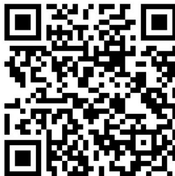
Рис. 3.1. Анонімне соціальне опитування щодо побутових відходів

Для встановлення ставлення громадян до законодавчих нововведень щодо роздільного збирання відходів ми розробили анкету та запропонували надати відповіді на її питання учасникам освітнього процесу ТОВ «Приватний заклад «Ліцей Професіонал» Харківської області». Досліджувані питання в основному були спрямовані на виявлення їх ставлення щодо роздільного збору відходів у повсякденному житті. Крім цього частина питань була спрямована на виявлення актуальних проблем у сфері вивезення і збору побутових відходів. Питання запропонованої анкети можна побачити за посиланням (рис. 3.1).