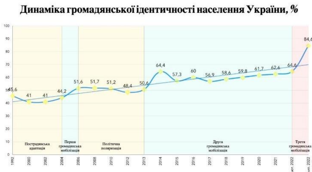
Рис. 2.2. Динаміка громадянської ідентичності населення України (%) [27]

За даними КМІС, за роки незалежності громадянська ідентичність українців зросла майже у два рази – з 45,6% до 84,6% (Рис. 2.2), зробивши тим самим маргінальними усі інші види ідентичності в територіальному та політичному контексті.