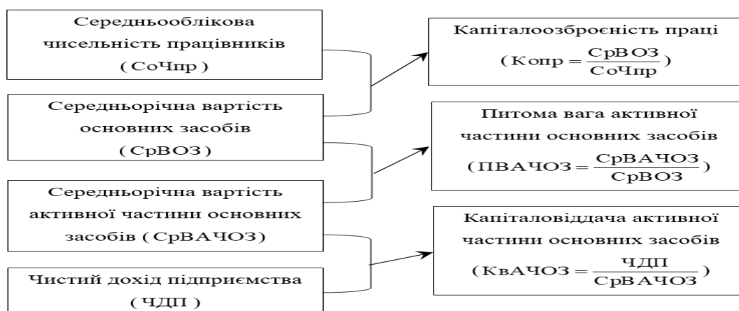
Рисунок 3.1 - Схема взаємозв'язку складових факторного моделювання впливу виробничо-трудова чинників на зміну чистого доходу підприємства

Однаковий підпис « Рисунок » повинні мати всі графічні матеріали звіту, такі як: діаграми, графіки, схеми, фотографії, рисунки, креслення тощо. Одразу після тексту, де відображено перше посилання на «Рисунок», або на наступній сторінці якнайближче до нього, а за потреби – у додатках до цієї роботи подають його. У межах розділу послідовно нумерують «Рисунки», за винятком їх, які подані в додатках. З номера розділу та порядкового номера «Рисунку» через крапку приписується його номер. У випадку, якщо «Рисунки» побудовані не автором кваліфікаційної роботи здобувача, то варто їх подавати в ньому, з дотриманням вимог чинного законодавства України про авторське право. З великої літери відображають назву «Рисунку» з абзацним відступом і вирівнюванням по ширині рядка, а також ставиться перед його назвою тире, наприклад, «Рисунок 3.1 – Схема взаємозв'язку складових факторного моделювання впливу виробничо-трудова чинників на зміну чистого доходу підприємства» та його зразок для наочності наведено на рисунку 2.4.