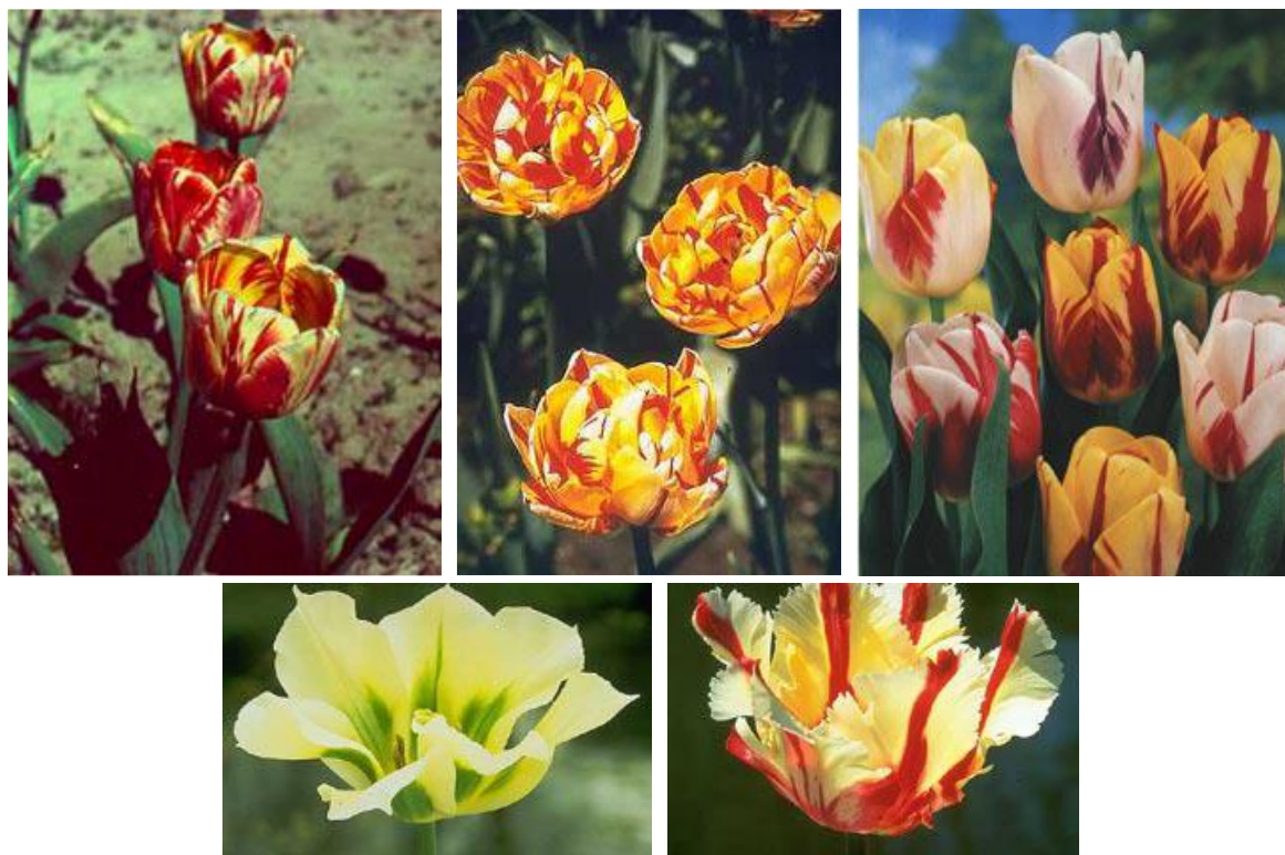
Рисунок 4 – Гарноквітучі заражені вірусом тюльпани (джерело зображень [23])

декоративних рослин. Проаналізувати ілюстрації (рис. 4) та визначити спричинений вірусом естетичний ефект.