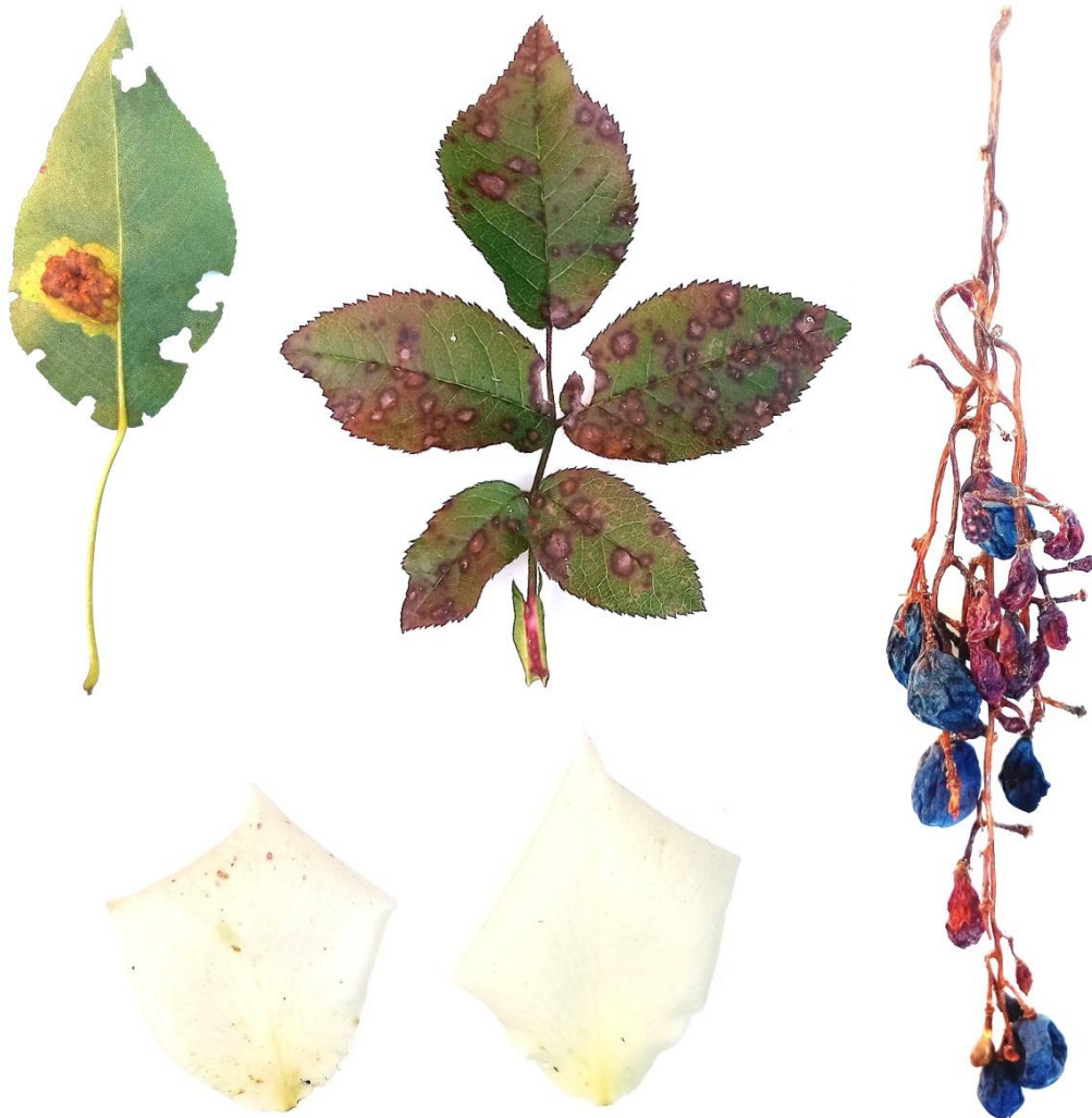
Рисунок 1 – Приклад відібраних зразків окремих органів рослин з ознаками хвороб або пошкодження комахами

практики (рис. 1). Студенту необхідно брати до гербарію по декілька зразків, які відображають їх варіанти. Обов'язково потрібно відбирати контрольний зразок без ознак ураження хворобами або пошкодження комахами.