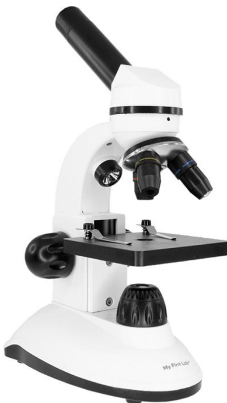
Рисунок 3 – Мікроскоп навчальний My First Lab MFL-06

Точні дані про морфологічні особливості організму можна отримати шляхом вивчення організму під мікроскопом (рис. 3). На сьогодні відомо безліч різних конструкцій мікроскопів для різних завдань. Найбільш поширеним вітчизняним мікроскопом є біологічний мікроскоп М-9 [6].