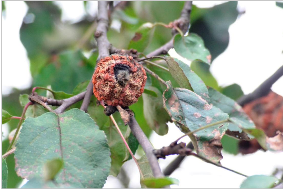
Рисунок 2 – Приклад фотофіксації плода деревної рослини з ознаками хвороби

2. Збір уражених хворобами та шкідниками рослин, їх окремих органів або частин.