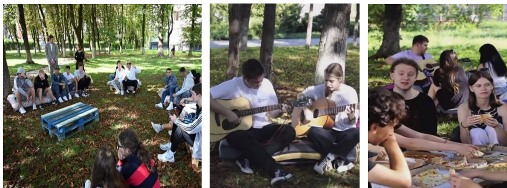
Рисунок 2 – Проведення заходу на озелененій території ІФНТУНГ

Ще одним яскравим прикладом є Івано-Франківський національний технічний університет нафти і газу (ІФНТУНГ). На території є достатня кількість озеленення з розташованими на ній відпочинковими зонами. Також ці території використовують з метою проведення різноманітних заходів за ініціативи студентського самоврядування, що дозволяє створити відпочинкову атмосферу (рис. 2).