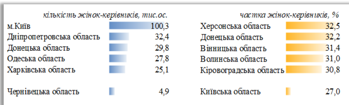
Рисунок 2 – Топ регіонів України за гендерними показниками у 2023 р. [2]

Характеристика регіонального аспекту даного питання представлена на рис.2.