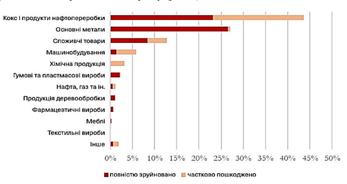
Рис. 1 – Структура збитків за галузями, % від загальних активів галузі [1].

Українська промисловість втратила понад 8,1 млрд. дол. через повномасштабну війну (дані станом на 1 липня 2022 р.). За оцінками, промисловість є третім сектором після інфраструктури та ЖКГ за загальною вартістю збитків і втрачених активів (8,4% від загальної суми), спричинених російським вторгненням в Україну (рис. 1).