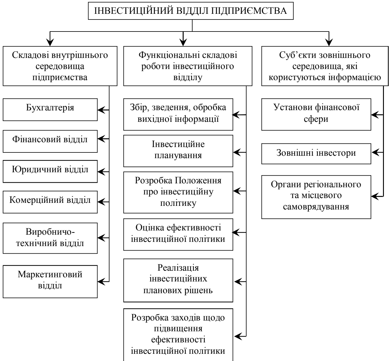
Рис. 2 – Схема інформаційних потоків інвестиційного відділу підприємства

використовуватися спеціалістами даних відділів для успішного здійснення своєї поточної діяльності. При цьому констатуємо, що схема інформаційних потоків інвестиційного відділу для наочності варто представити у вигляді рис. 2.