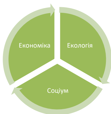
Рисунок 1 – Триєдина концепція сталого розвитку [8]

Отже, парадигма сталого розвитку полягає у об'єднанні триєдиної концепції (рис. 1).