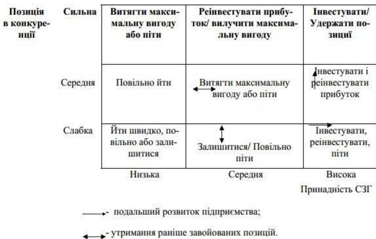
Рисунок 2 – Тривимірна матриця McKensey – General Electric

Використовуючи отримані в розрахунках значення принадності СЗГ і майбутнього КСО* визначити, яким квадрантом матриці McKensey – General Electric (рис. 2) описується стратегія підприємства.