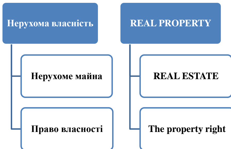
Рисунок 2.3 – Нерухома власність

Загальна схема для нерухомої власності та її аналог у зарубіжних джерелах виглядають, як зображено нижче (рис. 2.3).