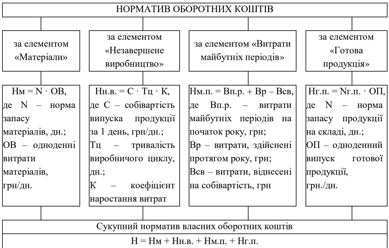
Рисунок 3.3 – Формування нормативу оборотних коштів

N_{\text{стр}} – норма страхового запасу. Визначається з метою запобігання непередбачуваним обставинам, а також підприємством самостійно на підставі аналізу таких випадків протягом минулого періоду, або у розмірі 50 % від N_{\text{пот}} . У випадку, коли поставка здійснюється в межах одного міста, страховий запас, як і транспортний, не створюється.