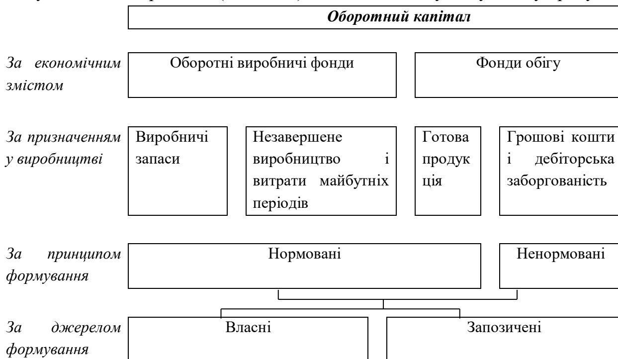
Рисунок 3.2 – Оборотний капітал

Абонентська заборгованість – сума грошових коштів, яку споживачі комунальних підприємств (абоненти) винні за спожиту комунальну продукцію.