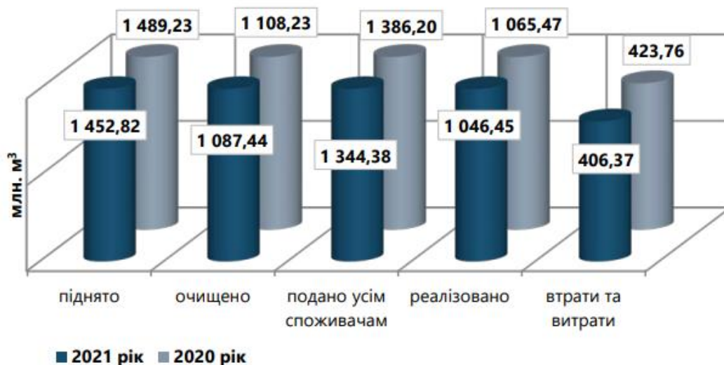
Рисунок 2.3 – Виробничі показники водопостачання по Україні

На власні потреби водопроводи витрачають воду в основному для промивання фільтрів і відстійників. Витрати на власні потреби залежать від типу очисних споруд, технології очищення, якості води, яка надходить до фільтрів, і становлять 3-5 % від під'єму води. Чим менше витрачається води на власні потреби, тим більше подача води в мережу. Отже, треба прагнути до максимального скорочення цих витрат без шкоди для технології виробництва.