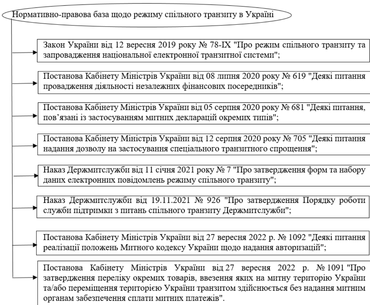
Рис.1 – Нормативно-правова база спільного транзиту (NCTS)

Як видно на рис.1, було запроваджено декілька постанов Кабінету Міністрів України та Держмитслужби України, які встановлюють основні засади організації та здійснення режиму спільного транзиту товарів митною територією України, порядок і умови переміщення таких товарів підприємствами митною територією України в режимі спільного транзиту, здійснення митних формальностей, застосування механізму гарантування сплати митного боргу, застосування спеціальних транзитних спрощень та інші особливості здійснення операцій режиму спільного транзиту.