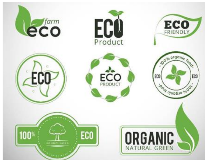
Рисунок 3 – Знаки екологічного маркування [41]