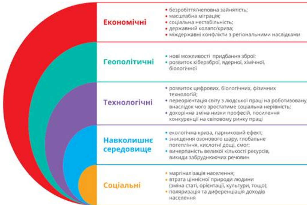
Рисунок 1 – Глобальні ризики найближчого десятиліття [3]

4. Критичні масштаби й темпи втрати людського капіталу. Вплив інтегральних ризиків за умови відсутності реагування на них і розробки превентивних заходів матиме безпрецедентні масштаби й руйнівний характер для національної економіки.