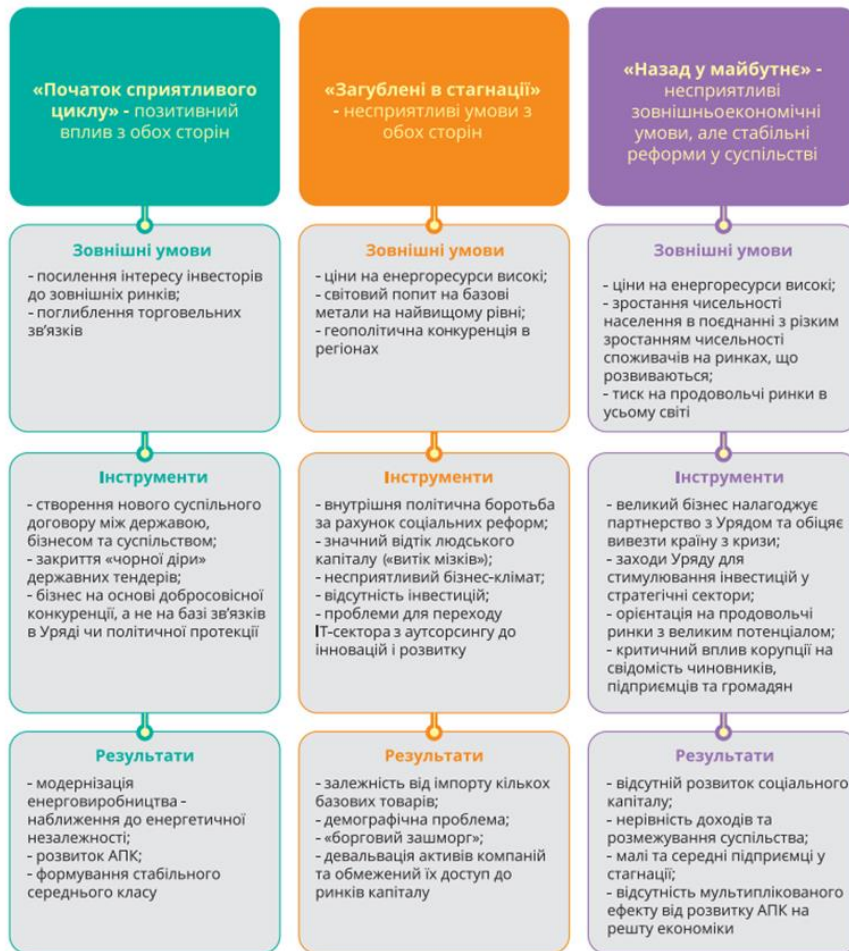
Рисунок 2 – Стратегічні сценарії майбутнього економіки України у візії Всесвітнього економічного форуму [32]