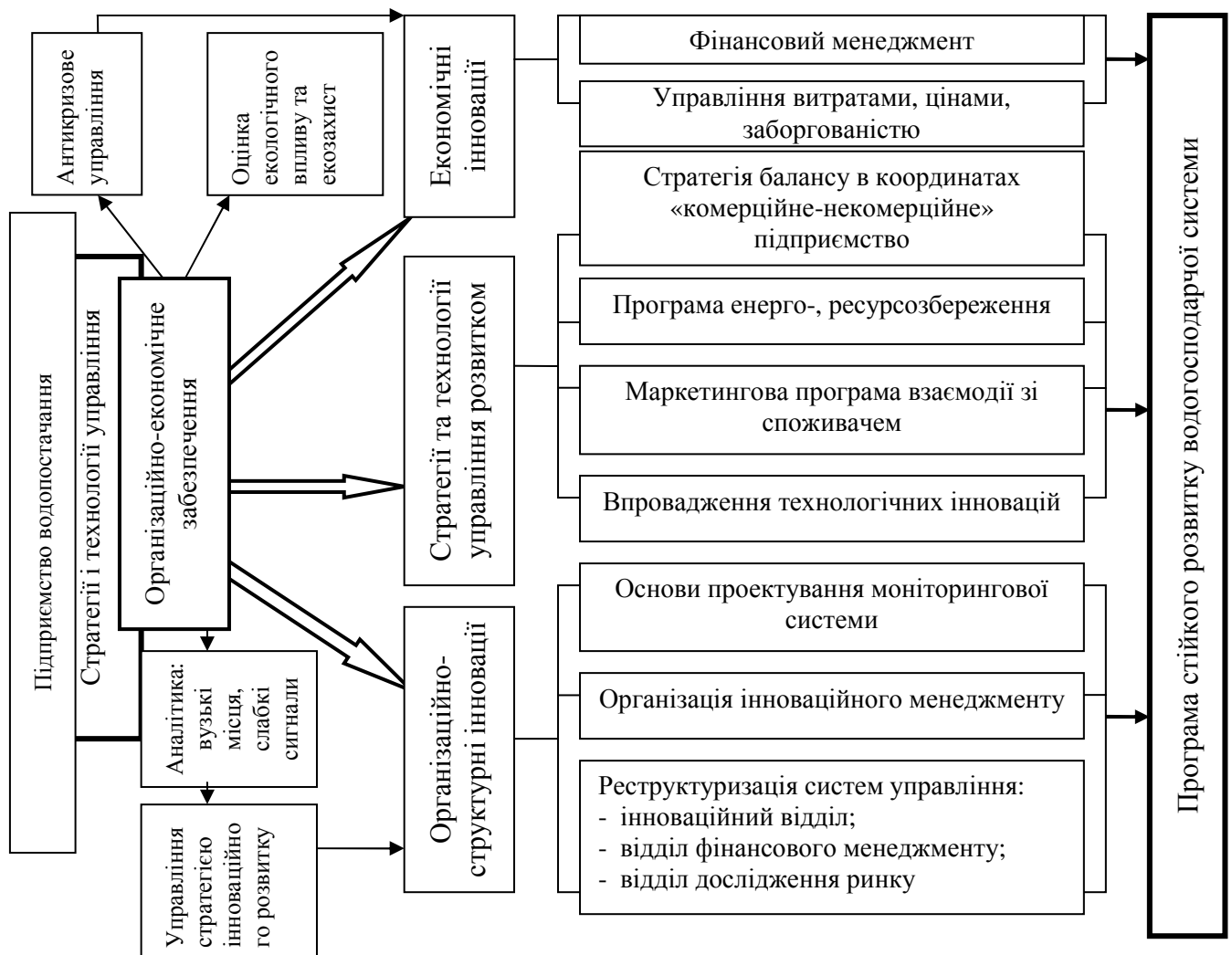
Рис. 3 - Структурна модель забезпечення організаційно-економічного механізму інноваційного розвитку підприємств водопостачання

Підприємства водопостачання в містах (в більшості міст України це ВКГ) виконують суто регіональне завдання, обслуговують чітко окреслену територію і мають єдину цілісну організаційно-технологічну структуру. Їх функціонування і розвиток все більше стає їх прямою функцією. Тому і тактичні, і стратегічні завдання в нових умовах підприємства вирішують самостійно. На даний час на підприємствах напрацьовані два взаємопов'язаних методи управління своїм економічним станом і забезпеченням саморозвитку: балансовий механізм і метод стратегічного проектування. Поєднує ці методи організаційно-економічний механізм інноваційного розвитку (рис. 3).