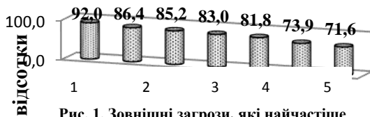
Рис. 1. Зовнішні загрози, які найчастіше згадували респонденти

У той же час, середній бал, який виставили респонденти різних банків однаковим загрозам суттєво різняться. Так, найбільш згадувана зовнішня загроза «Зміна законів» співробітниками «ПриватБанку», «УкрЕКСІМБанку», «УкрГазБанку», «УкрСоцБанку» оцінена в середньому на 3 бали – достатньо суттєва і вагома, має суттєвий вплив на рівень фінансової безпеки банку. Найбільш високий середній бал дана загроза отримала від фахівців «ПравексБанку» – 1 бал. Спеціалісти з інших банків оцінили загрозу зміни законів в середньому на 7 балів.