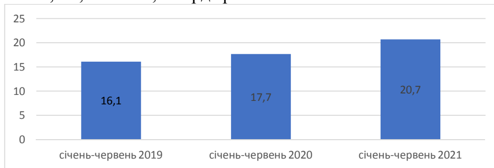
Рисунок 2 Надходження єдиного податку, млрд грн

Надходження єдиного податку склали 20,7 млрд. грн, збільшення надходжень проти січня-червня 2020 року становить 16,8 %, або на 2 980,0 млн грн більше. Надходження єдиного податку за січень-червень 2020 року склали 17,7 млрд гривень. Приріст надходжень проти співставного періоду 2019 року становить 9,6%, або на 1,6 млрд грн більше.