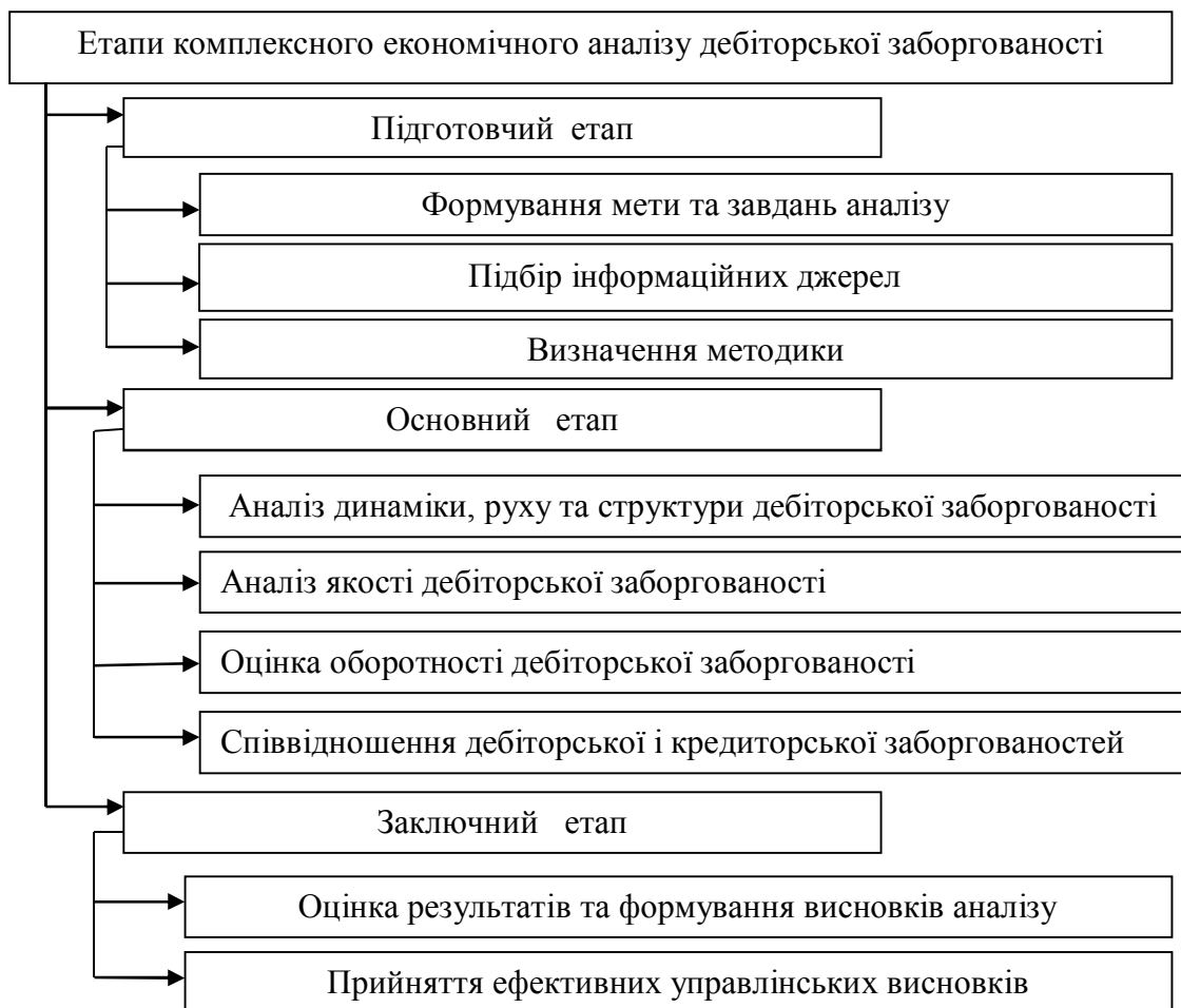
Рис. 2. Етапи комплексного економічного аналізу дебіторської заборгованості

Отже, узагальнюючи вищевикладене, комплексний аналіз дебіторської заборгованості представимо у наступному вигляді (рис.2).