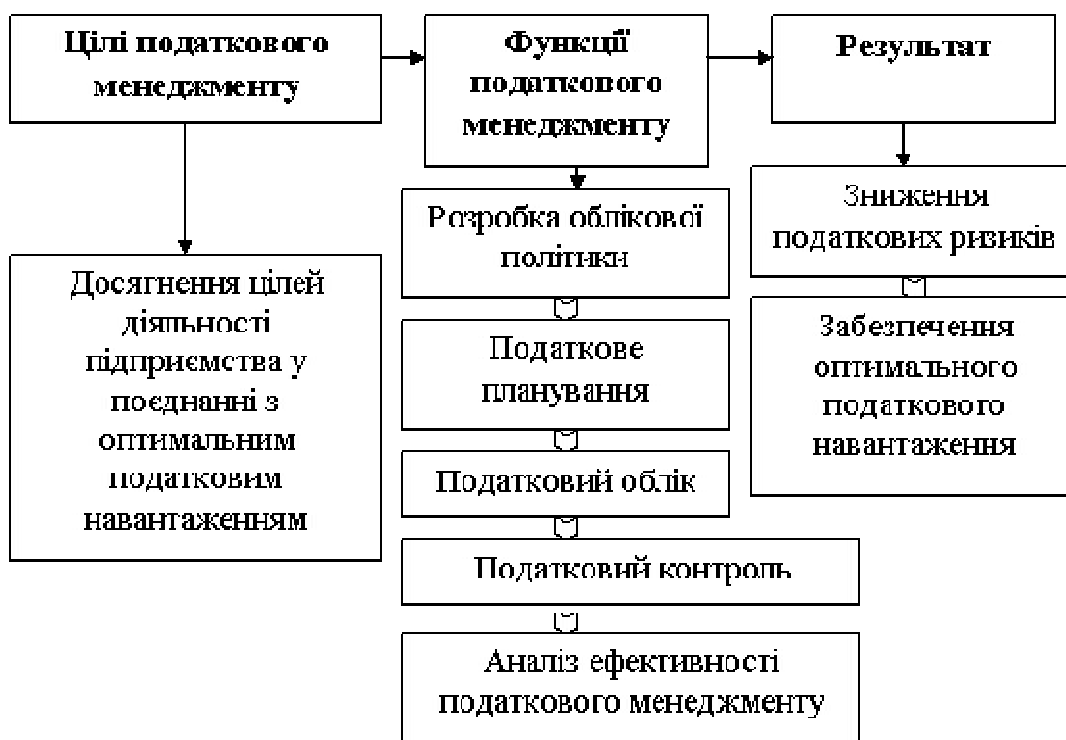
Рис. 2 Цикл податкового менеджменту підприємства

Отже, метою податкового менеджменту є розробка та реалізація податкової стратегії, яка дозволить оптимально поєднати податкове навантаження та максимально досягнуті результати підприємства. Основними функціями реалізації податкового менеджменту є: податкове планування, розробка способів і методів ведення бухгалтерського, податкового обліку, контроль за правильністю та достовірністю податкових розрахунків, зниження податкових ризиків, оцінка ефективності принципів та способів податкового планування. Таким чином, результатом податкового планування є організація правильного та достовірного розрахунку податків, забезпечення оптимального податкового навантаження та доданої вартості відповідно до цілей та завдань організації. В цілому, цикл податкового менеджменту суб'єкта господарювання можна відобразити наступним чином (рис. 2).