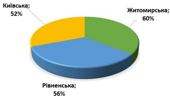
Рис. 4. Області України з найбільшим радіаційним забрудненням лісів

Від промислових викидів за останнє десятиріччя в Україні загинуло 2,5 тис. гектарів лісових насаджень, радіаційного забруднення через аварію на Чорнобильській АЕС зазнали близько 3,5 млн. га лісів (40% від загальної їх площі), з яких 157 тис. га повністю виведено з господарського обігу, а решта потребує обмеження лісокористування, удосконалення системи протипожежної безпеки лісів [7]. Найбільше радіаційне забруднення лісів відбулося у Житомирській, Рівненській та Київській областях (рис. 4). Рівень радіаційного забруднення лісів Черкаської, Чернігівської та Вінницької областей складає біля 20% [8].