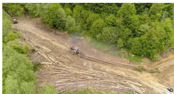
Рис. 3. Вирубка лісів Карпат