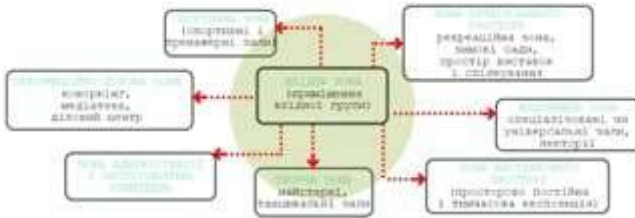
Схема 2 – Структура універсального молодіжного центру

Структура універсального молодіжного центру (Схема 2):