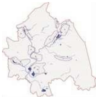
Рисунок 1 – підтоплені території міста Харкова

У місті Харкові в підтопленому стані знаходяться масиви Основи, Журавлівки, Центрального ринку, заводів "Будкераміка" та "Комсомолец", дамби по проспекту Леніна через Саржин Яр, схили річкової долини вздовж вулиці Клочківської, Журавлівські схили та інші.