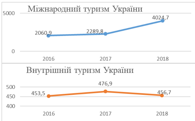
Рис. 1 – Показники внутрішнього та міжнародного туризму в Україні за 2016-2018 рр.

рішнього туризму знизилась, та кількість, подорожуючих країною, скоротилась на 4% в порівнянні з попереднім роком й склала 456,7 тис. осіб. Хоча по відношенню до 2016 р. величина цього показника зросла на 0,7 %.