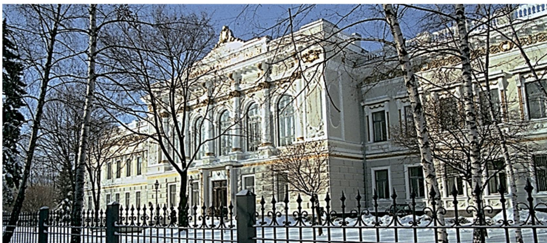
Харківський Земельний і Торгівельний банки О.К. Алчевського, нині Автотранспортний технікум(м. Харків, пл. Конституції, 2)