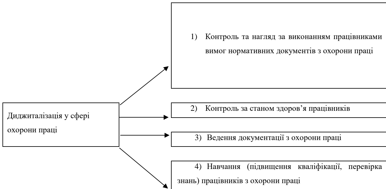
Рис. 2. Основні кластери впровадження цифрових технологій у сфері охорони праці

Використання «Електронної медичної карти працівника» (які введено в дію з 1.03.2020 в Україні), з санкціонованим доступом роботодавців і працівників, може нагадувати про необхідність проведення щорічного медичного огляду і пришвидшити саму процедуру. Також використання ІТ здатне скоротити час проходження працівником щоденного медогляду у кілька разів. Для порівняння з традиційним методом (вимірювання пульсу, тиску, серцевого ритму, температури, тести на алкоголь і наркотики) обробка інформації та видача висновку в цілому займають трохи більше хвилини. Диджиталізація сфери трудових відносин розширює можливості взаємодії між працівником і роботодавцем. Переведення на електронний документообіг суттєво спростить життя і забезпечить оптимізацію системи і методів проведення диспансеризації з організацією попередніх і періодичних медичних оглядів (обстежень) та психіатричних оглядів працівників, зайнятих на роботах зі шкідливими і (або) небезпечними умовами праці.