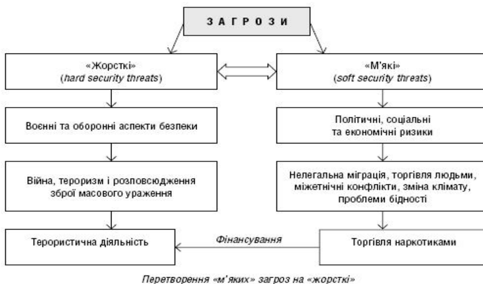
Рисунок 3.2 – «Жорсткі» та «м'які» загрози міжнародній економічній безпеці

Загрози міжнародній економічній безпеці також можуть бути умовно поділені на «жорсткі» та «м'які» (рис. 3.2).