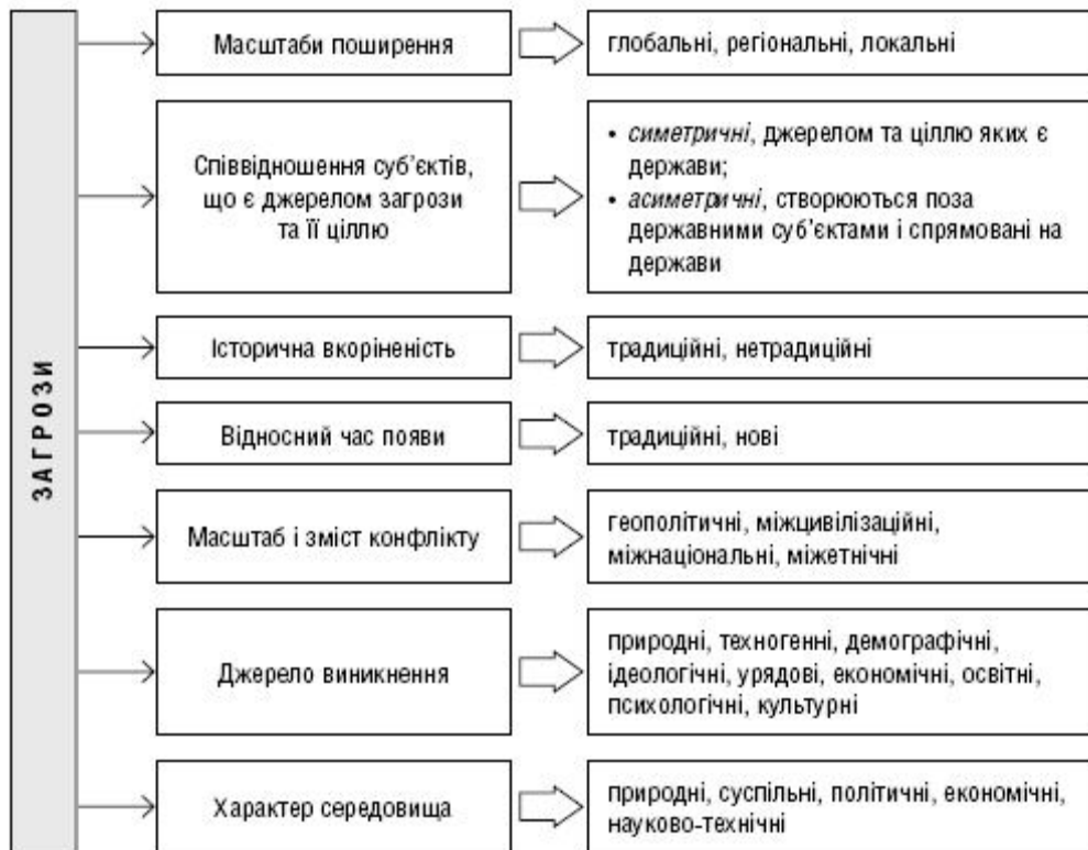
Рисунок 3.1 – Класифікація загроз міжнародній економічній безпеці

Загрози міжнародній економічній безпеці також можуть бути умовно поділені на «жорсткі» та «м'які» (рис. 3.2).