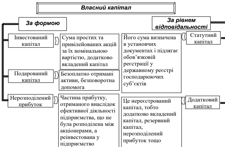
Рисунок 1– Класифікація власного капіталу за формою та рівнем відповідальності

Більшість вчених класифікують власний капітал за його складом.