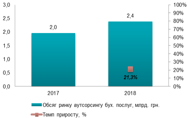
Рисунок 1 – Аналіз динаміки обсягу ринку аутсорсингу бухгалтерських послуг

Таким чином, бухгалтерський аутсорсинг поступово знаходить своє застосування у вітчизняній практиці. При цьому можна зробити висновок, що для великих підприємств доцільність переходу на бухгалтерський аутсорсинг не є однозначною і вимагає детального аналізу в умовах конкретної управлінської ситуації. У той же час для невеликих підприємств і індивідуальних підприємців перехід на бухгалтерський аутсорсинг є сьогодні єдиною оптимальною і практично безальтернативним способом мінімізації витрат із ведення бухгалтерського обліку. Отже, бухгалтерський аутсорсинг – ідеальний варіант для отримання вигідного та компетентного бухгалтерського обслуговування та бухгалтерського супроводу та останнім часом спостерігається розвиток попиту на надання даного виду послуг.