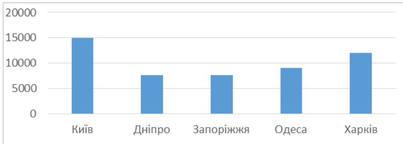
Рисунок 1 – Аналіз розміру середньої зарплати аудитора в Україні

Проведений аналіз результатів аудиторської діяльності та стану ринку аудиторських послуг свідчить, про те, що аудиторський ринок потерпає від змін, які відбуваються в країні, який свідчить, що аудиторський ринок функціонує і трансформується внаслідок дії низки факторів, зокрема: кризові явища у суспільстві; посилення вимог до аудиторської професії з боку регуляторів; недосконалість законодавчої бази; відсутність довіри користувачів до якості і достовірності аудиторських послуг; відсутність механізму формування цін на аудиторські послуги; відсутність покарань за недостовірну інформацію у звітах аудиторів; недостатня кількість висококваліфікованих аудиторів; зниження платоспроможності замовників аудиту. Протягом аналізованого періоду спостерігається стійка тенденція до збільшення доходу суб'єктів аудиторської діяльності, незважаючи на те, що їх кількість постійно зменшується.