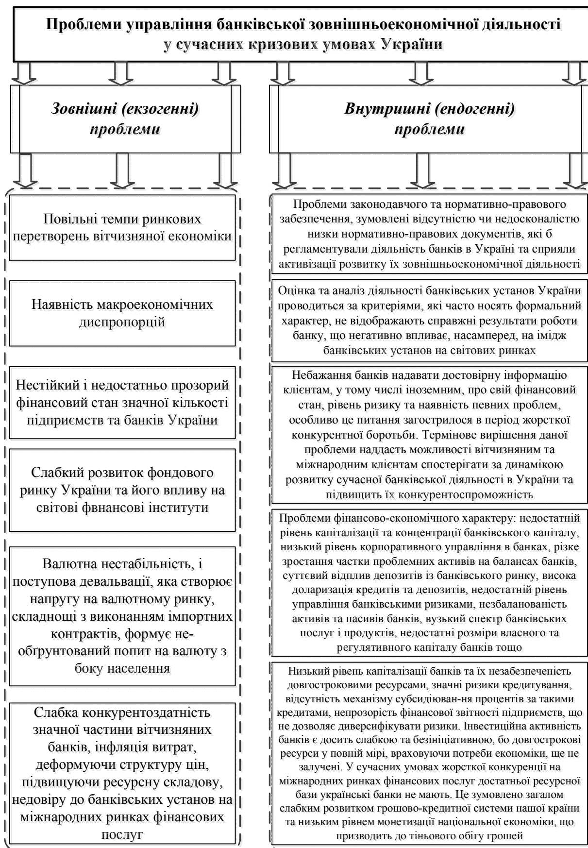
Рис. 1 – Проблеми управління банківською зовнішньоекономічною діяльністю у умовах кризової економіки України (розроблено автором на підставі [1])