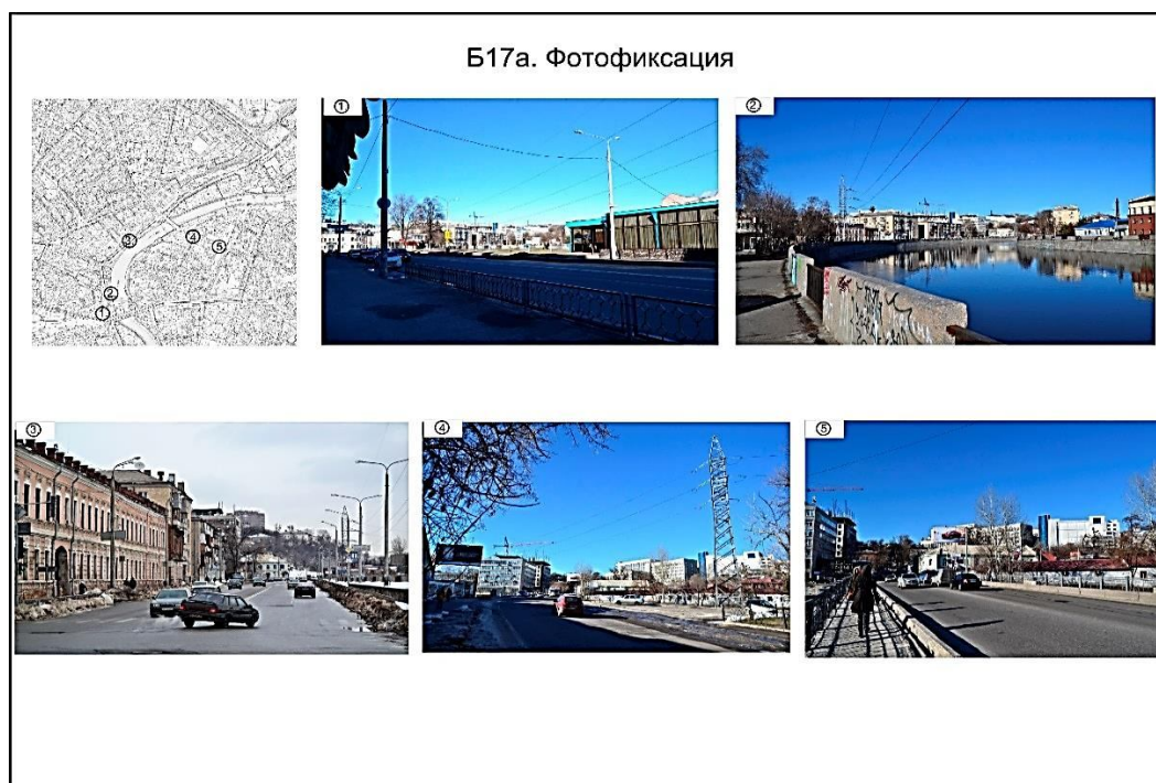
Рисунок 1 – Приклад та фотофіксація території об'єкта дослідження

Завдання. Обстежити та зафіксувати за допомогою фотозйомки особливості території об'єкта дослідження (рис. 1)