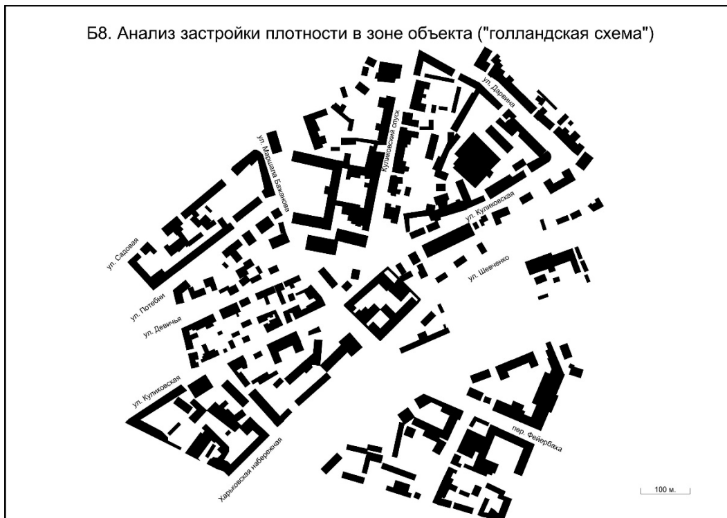
Рисунок 9 – Приклад схеми щільності забудови