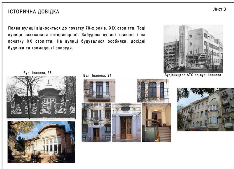
Рисунок 4 – Приклад складання історичної довідки об'єкт

Завдання. Скласти коротку історичну довідку щодо об'єкту дослідження на основі знайдених та опрацьованих бібліографічних та архівних джерел (рис. 4)