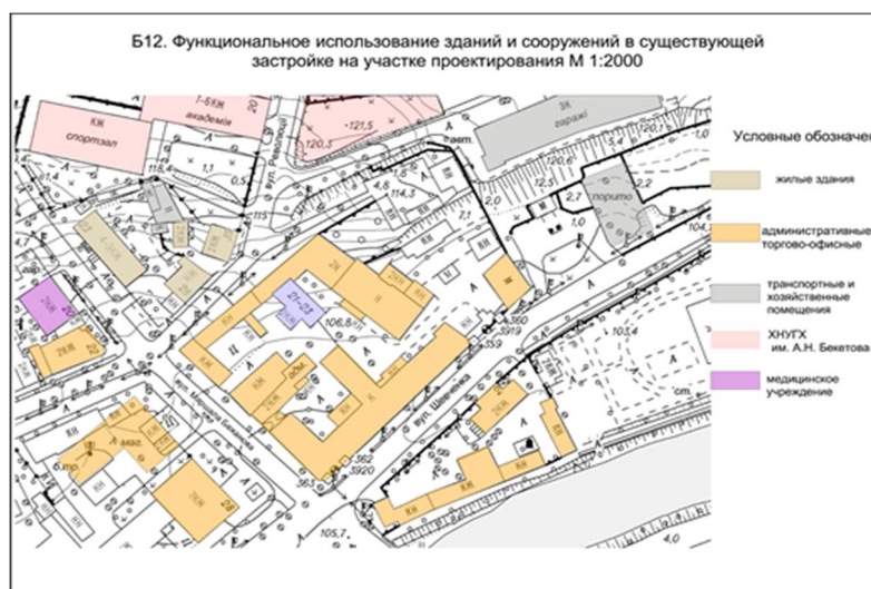
Рисунок 7 – Приклад схеми функціонального зонування території