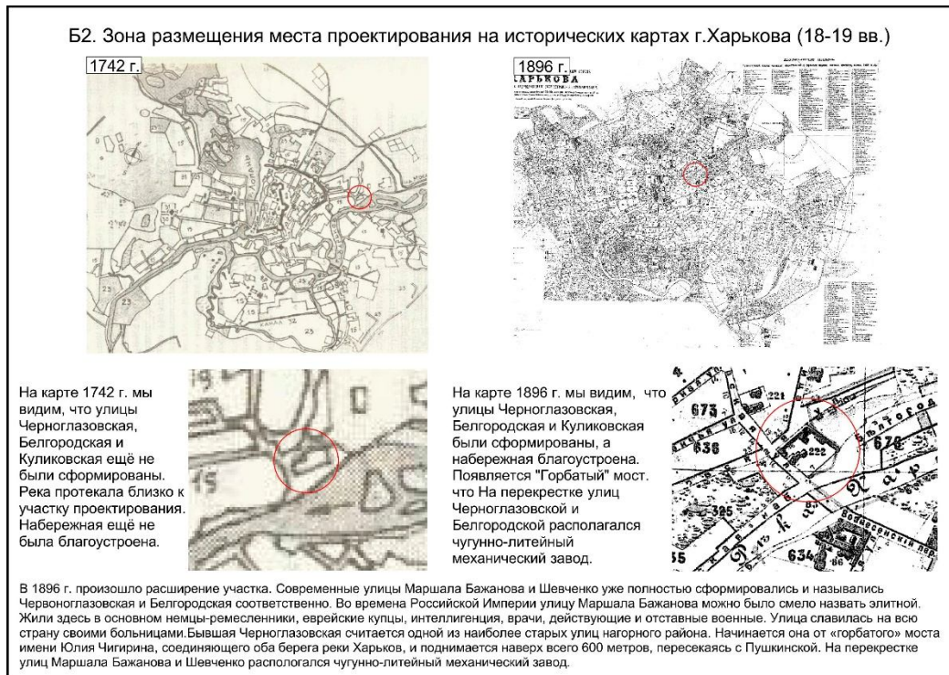
Рисунок 2 – Приклад оформлення «Графічного завдання 3»

Завдання. Провести пошук історико-містобудівних картографічних (плани, карти, схеми, топографічні підоснови, тощо) та історико-архітектурних іконографічних (фотографії, листівки, ілюстрації у періодиці, тощо) матеріалів (рис. 2).