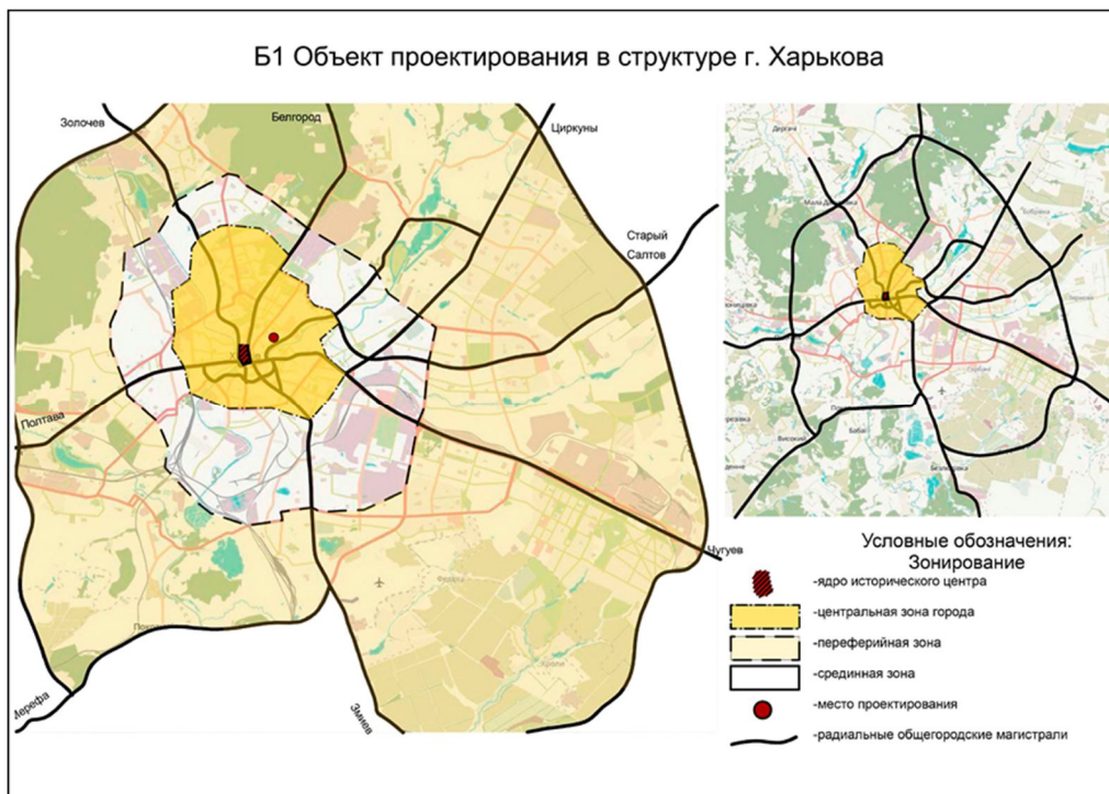
Рисунок 6 – Приклад розміщення об'єкта дослідження в структурі міста