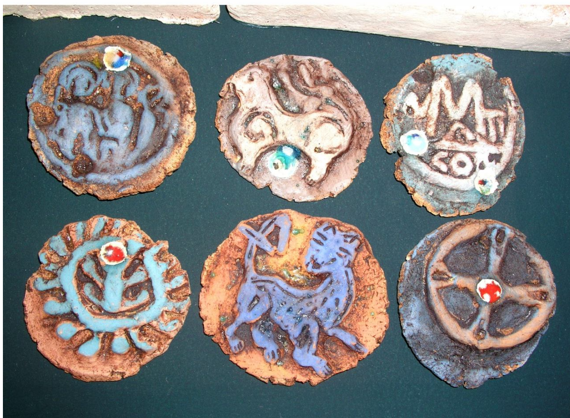
Рисунок А.3 – Керамічні елементи декоративно-тематичного панно