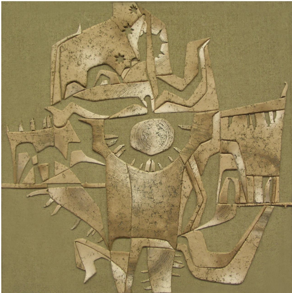
Рисунок А.5 – Декоративний ефект різних переходів тонально-кольорового характеру в елементах панно