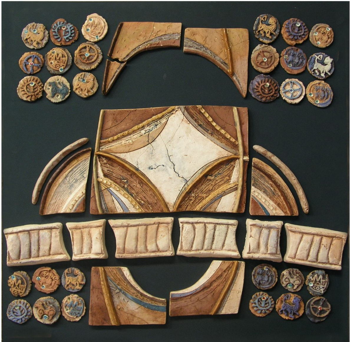
Рисунок А.2 – Декоративно-тематичне панно у техніці модульної кераміки