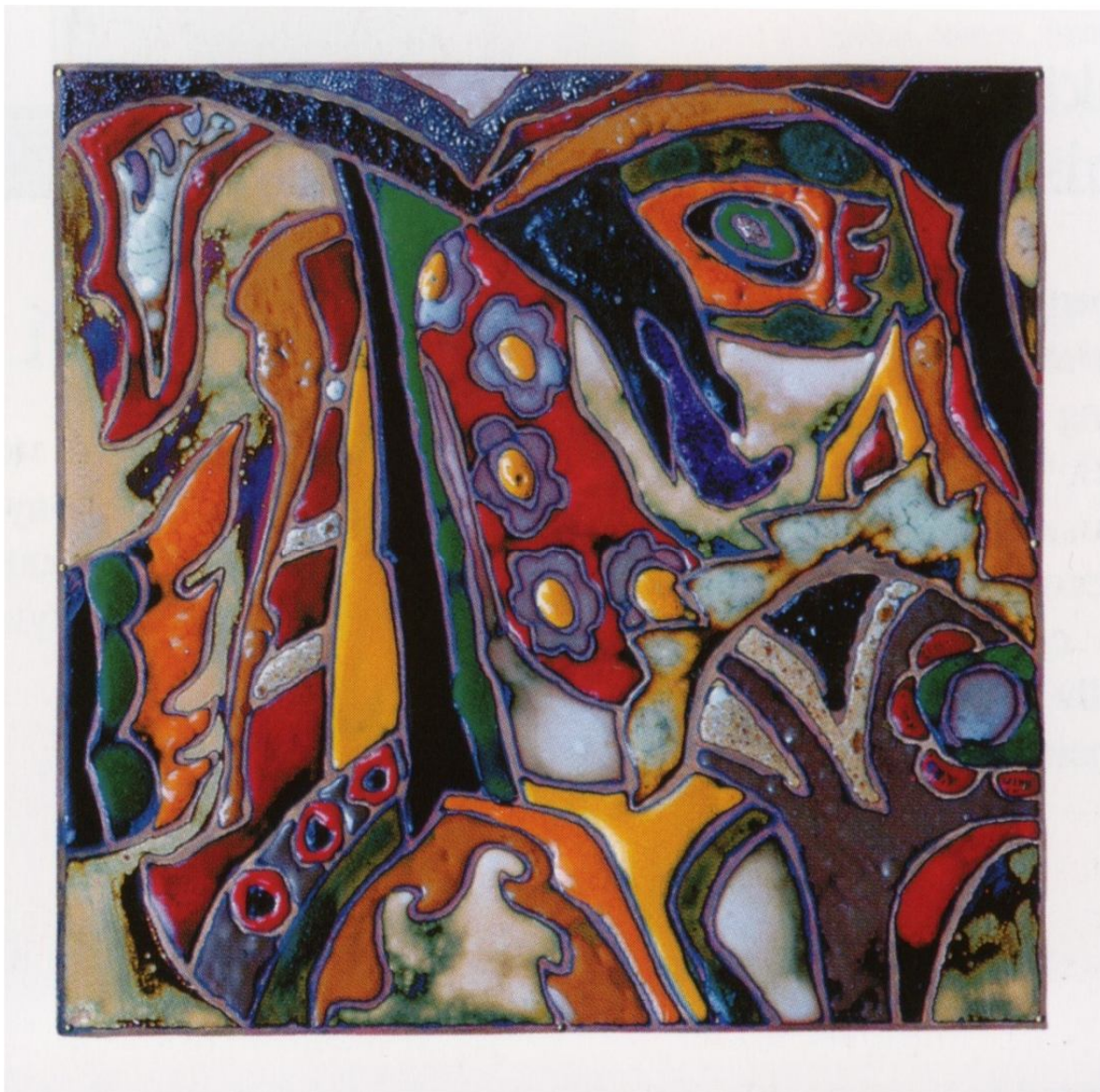
Рисунок А.6 – Декоративно-тематичне панно із кольоровою емаллю