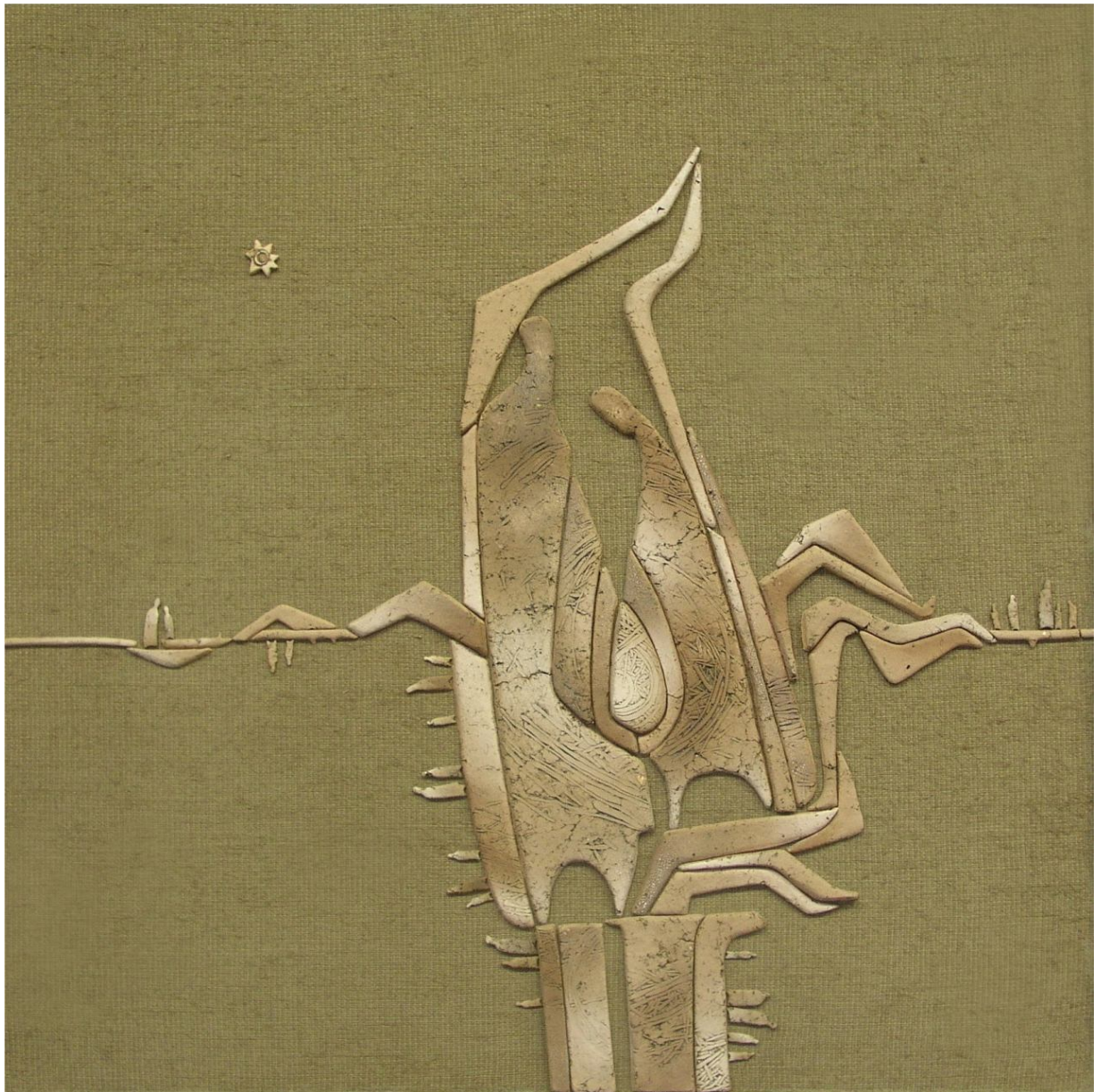
Рисунок А.4 – Декоративно-тематичне панно із шамотної маси