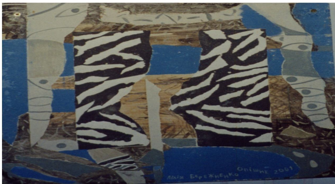
Рисунок А.1 – Декоративні орнаменти на елементах панно