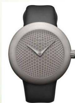
Наручний годинник Horizon, 2006.