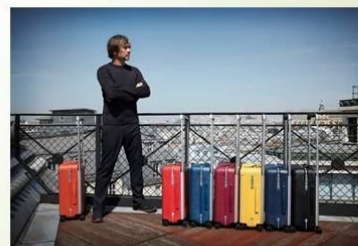
Коллекція валіз, Louis Vuitton, 2016.

Рисунок А.4 – Презентація студентки 3 курсу А. Шевцової, 2020 р. Продовження 3