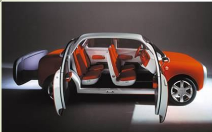
021C Concept Car, Ford, 1999.