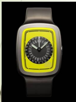
Наручний годинник Manatee, 2001.