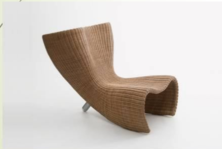
Wicker Chair. Крісто, 1988