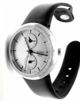
Наручний годинник Isopode, 2001.