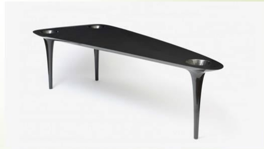
Black Hole Table. Стін, 1989.