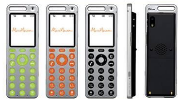
Tally Mobile Phone, 2003.