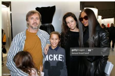
Марк Ньюсон з дружиною та дітьми

У 2008 році, Ньюсон одружився з Шарлоттою Стокдейл, модною стилісткою. На даний момент, у них двоє дітей. Родина живе в Лондоні з 1997 та має будинок і студію в Парижі.