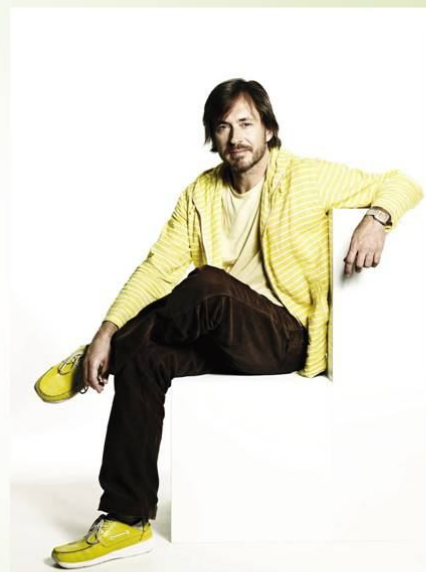
Marc Newson (Марк Ньюсон)

Зараз Ньюсон відомий сучасний промисловий дизайнер, який працює в галузі архітектури, дизайну меблів і товарів, консірних прикрас, одягу. Він використовує стиль дизайну, відомий як біоморфізм, для створення красивих і ергономічних речей. Цей стиль включає плавні текучі лінії, півпрозорість, прозорість, відсутність гострих кутів, використання високотехнологічних матеріалів.