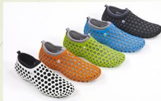
Zvezdochka Shoes, 2001.