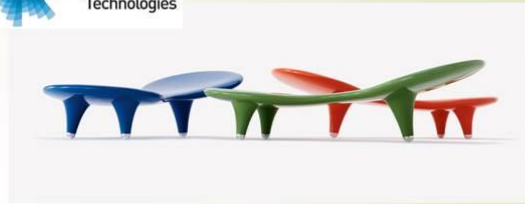
Orgone Lounge. Швеція, 1992.

Коли японський підприємець Теруо Куросаки (Teruo Kurosaki) запропонував почати виробництво речей Ньюсона, дизайнер погодився, відправився в Токіо і прожив там з 1987 по 1990 рік. Компанія Куросаки, Ide, виробляла такі ньосонські об'єкти як Orgone Lounge, Black Hole Table та Felt Chair, які швидко саксонувалися в Європі і Азії.