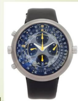
Наручний годинник Megalopode, 2002.

Рисунок А.3 – Презентація студентки 3 курсу А. Шевцової, 2020 р. Продовження 2