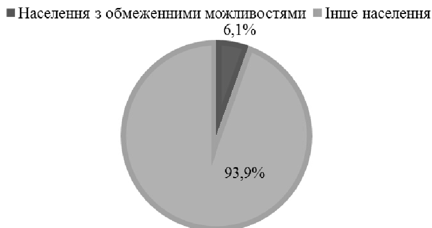
Рис. 2. Доля населення з обмеженими можливостями в Україні