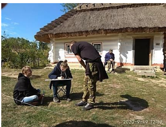
Рис. 1. Студенти під час виконання обмірів на території садиби з с. Яснозір'я" 2020 р.

Отже, проект послідовно розвивається та зарекомендував себе як інноваційну складову архітектурно-містобудівельної освіти, став значним внеском до фахової кваліфікації майбутнього містобудівника, починаючи з першого року навчання професії. Деякі матеріали, виконані студентами доповнили архів Музею креслениками генпланів окремих садиб(див.рис.2), що підтверджує успішність та необхідність проекту.