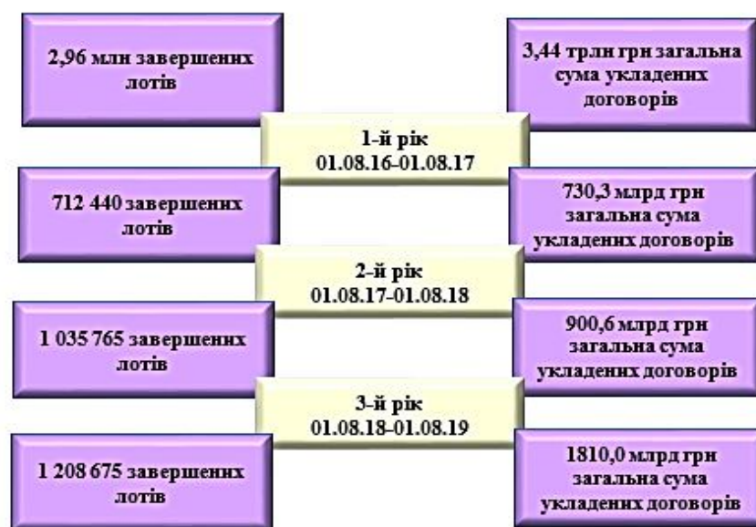
Рисунок 1 – Результати роботи електронної системи публічних закупівель за три роки (складено на основі [1, 2])

З моменту створення та станом на початок 2020 року всього в електронній системі закупівель зареєстровано близько 35 тис. організаторів закупівель та понад 210 тис. учасників закупівель. Оголошено 2,730 млн закупівель очікуваною вартістю майже 2,072 трлн грн, з яких: 458 тис. надпорогових закупівель з очікуваною вартістю 1,626 трлн грн, 784 тис. допорогових закупівель з очікуваною вартістю майже 235 млрд грн та опубліковано 1,488 млн звітів про укладені договори на суму 210 млрд грн. Укрупнені результати роботи електронної системи публічних закупівель за три роки представлено на рис. 1.