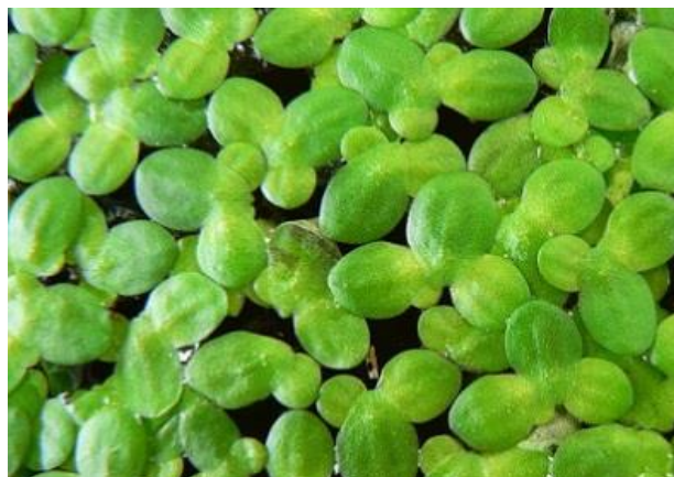
Рисунок 7.4 – Ряска

Ряска також рослина, що плаває на поверхні, покриває поверхню красивим оксамитним килимом. Однак характеризується сильним розростанням. Зазвичай її використовують для створення тіні і корму для риб. Краще всього використовувати ряску тридольну, так як вона менше всього розростається.