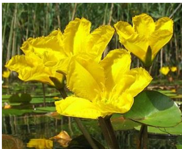
Рисунок 7.2 – Болотноквітник

Болотноцвітник. Цвіте з липня до вересня. Листя цієї рослини за формою схожі на листя латагті, але мають невеликий розмір близько 5 сантиметри в діаметрі, жовті квіти діаметром близько 4 сантиметри зібрані в суцвіття. Рослина досить швидко розростається. Болотоквітник – є родичкою водяної лілії, але не такий красивий, має дрібні квітки. На відміну від лілії, болотоквітники добре ростуть в проточній воді і в невеликому затіненні. Має кілька різновидів: малий і карликовий, що підходять для ставка середніх розмірів. Більш великі види: японський і кубушка, вимагають великої водойми.