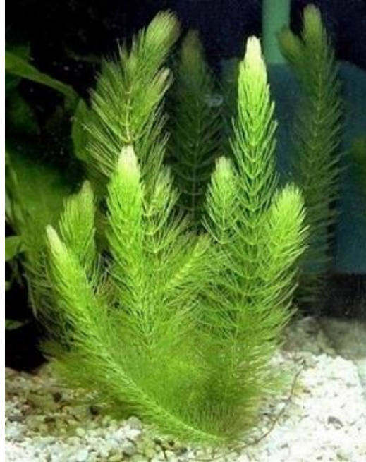
Рисунок 7.5 – Роголистник

Роголистник – підтримує біологічної рівновагу у воді. Рослина не має коренів і якщо вона почне занадто розростатися, то досить просто дістати з води надлишки. Дуже легко поселити в свою водойму цю рослину, для цього достатньо кинути у воду кілька живців. Зимує як і інші поверхневі рослини у вигляді бруньок відновлення на дні.