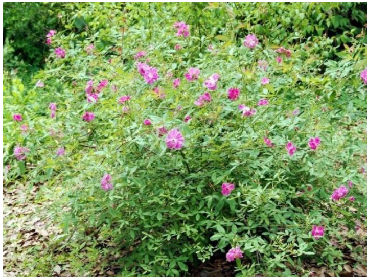
Рисунок 7.7 – Пенсильванская троянда ( Rosa palustris )

Розі болотній необхідна щорічна обрізка на пень самих старих гілок і постійне омолодження, своєчасне видалення порослі для обмеження поширення, при потребі – формування кущів.