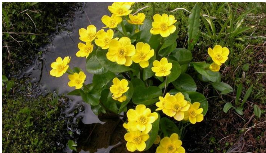
Рисунок 7.12 – Калюжниця болотна ( Caltha palustris )

Це самий невибагливий з усіх ірисів, що росте у вологих місцях в нашій смузі, з потужними ремневідной вертикальними листами до 1,2 м заввишки і рясним цвітінням. Особливо варто відзначити форму ірису болотного з білими квітками, а також різновид з махровими квітками. Ошатна ряболиста форма ірису болотного «Variegata» висотою 60–70 см, навесні листя цього сорту біло-зелені, влітку повністю зеленіють. Прекрасно себе почуває на сонці і в тіні. Глибина посадки у воду 5–25 см.