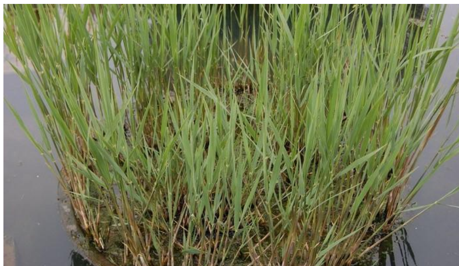
Рисунок 7.14 – Очерет звичайний ( Phragmites australis )

Очерет звичайний (Phragmites australis) багаторічна видова рослина висотою до 4 м, з довгими і товстими, повзучими кореневищами і прямостоячими стеблами з численними вузлами, занадто велике для садового ставка. Воно утворює зарості на сирих місцях, по берегах природних водойм. Листя видового рослини сірувато-зелені, жорсткі, подовжені, широкі. Суцвіття – велика волоть з безліччю окремих буро-фіолетових або жовтуватих дрібних колосків. Цвіте в липні – серпні.