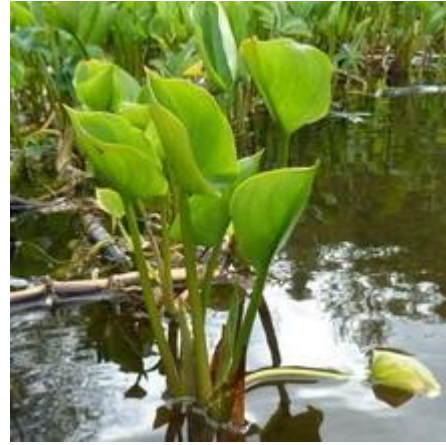
Рисунок 7.9 – Образки болотні ( Calla palustris )

Образки болотні (Calla palustris) – це невисокий багаторічник заввишки 15–20 см цікавий великими білими квітками з жовтим качаном, що з’являються з середини травня до кінця червня. До кінця літа утворюються яскраві червоні плоди. Його висаджують на глибину 5–10 см, він покращує якість води. Якщо висадити його на сонячному місці в спокійній воді, його блискучі серцеподібне листя шириною до 20 см з часом повністю закриють берег ставка, рослина утворює щільний килим, росте швидко, але легко контролюється.