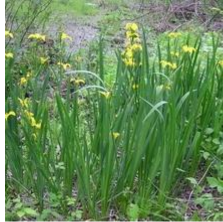
Рисунок 7.11 – Ірис болотний ( Iris pseudacorus )