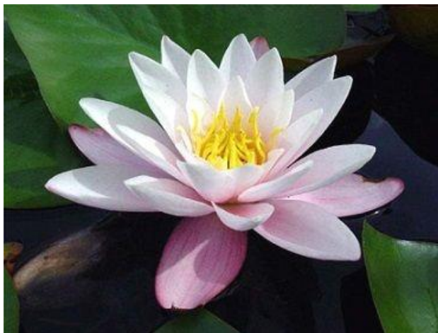
Рисунок 7.1 – Латагтя

не всі можуть прижитися в нашому кліматі. Також потрібно врахувати необхідну глибину посадки і площу покриття поверхні водойми квітами. Не повинно бути вкрита листям більше половини поверхні води.