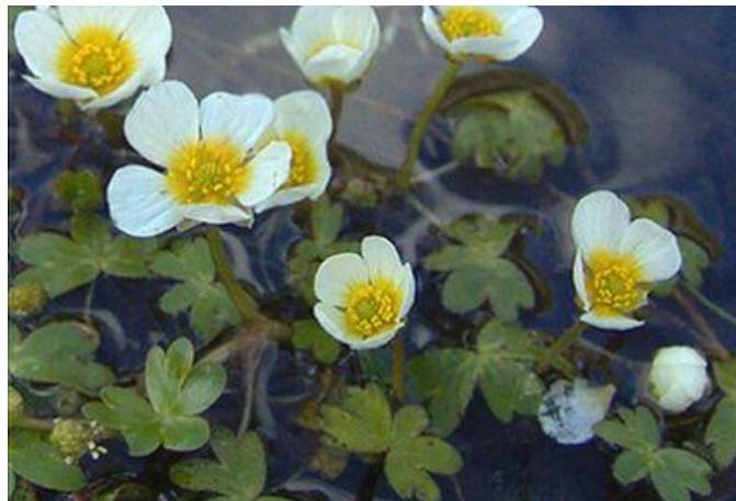
Рисунок 7.6 – Лютик водний

Лютик водний . Цвіте білими або жовтими квіточками з червня до вересня. Після цвітіння надводна частина відмирає.