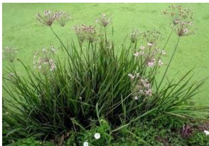
Рисунок 7.13 – Сусак зонтичний ( Butomus umbellatus )

Привабливо і видове рослина, але особливо гарні садові форми з білими махровими квітками і жовтими квітками.