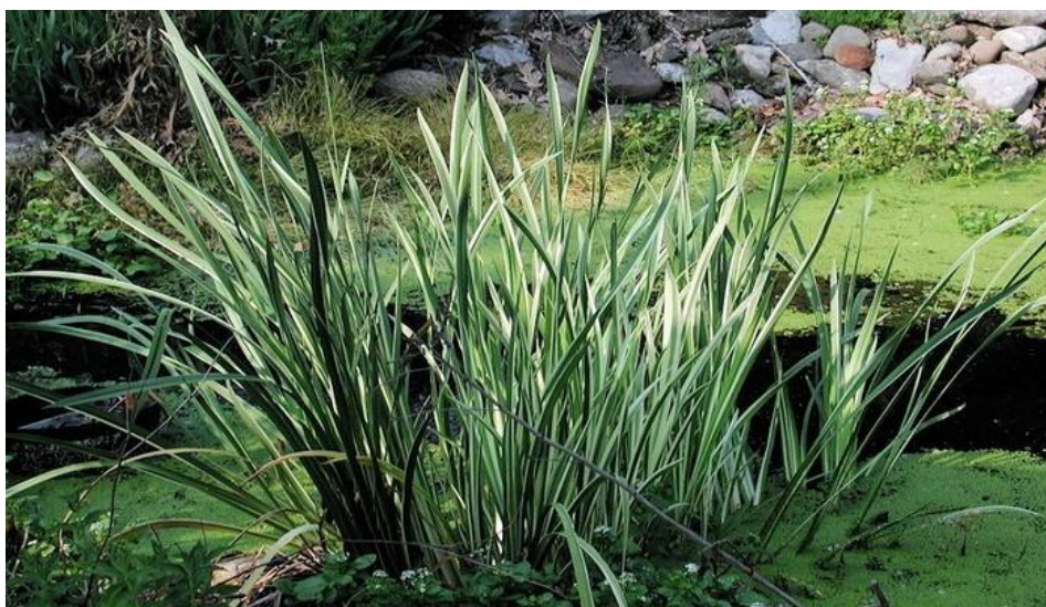
Рисунок 7.8 – Аїр болотний ( Acorus calamus )

Коріння цих рослин треба розташовувати біля берега, в ґрунті під водою, більша частина самого рослини знаходиться над поверхнею води, в повітрі. Ці рослини мілководдя пом'якшують кордон між водою і берегом, їх квітки і листя прикрашають ставок і струмок. Таких рослин є чимало, в залежності від виду їх висаджують у воду на глибину до 15–30 см на терасу у ставок або на мілководді. Їх коріння розташовуються або в кошику, або безпосередньо в ґрунті.