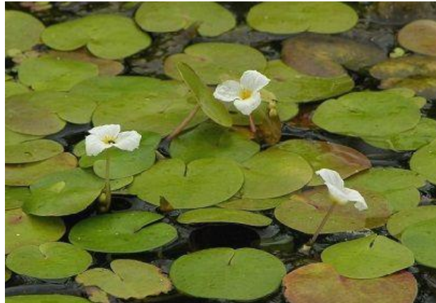
Рисунок 7.3 – Водокрас

Водокрас чудово підходить для маленького ставка, так як досить повільно розростається. Листя можуть мати діаметр від 2,5 до 5 сантиметрів. Цвіте з липня по вересень. Восени листя відмирає, а на дно опускаються бруньки, які на наступний рік піднімуться і дадуть початок новій рослині. Для того щоб гарантовано зберегти рослину до наступного року можна взяти кілька бруньок разом з частиною мулистого дна і водою, та зберігати їх в зимовий час у банці.