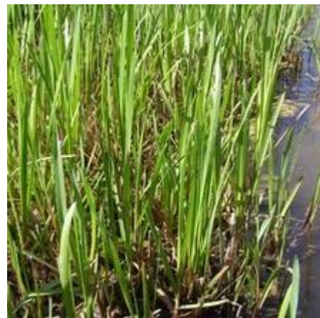
Рисунок 7.10 – Манник ( Glyceria )

Сорт лепешняку великого, або водного (манник) (G. maxima), «Variegata» з жовтуватими поздовжніми смугами на листках досягає висоти 50–60 див. Добре росте в півтіні, швидко вкорінюється, відрізняється агресивним зростанням. На перезволожених місцях і мілководдя на глибині до 15 см утворює пишні куртини, але і на сухих ділянках розростається