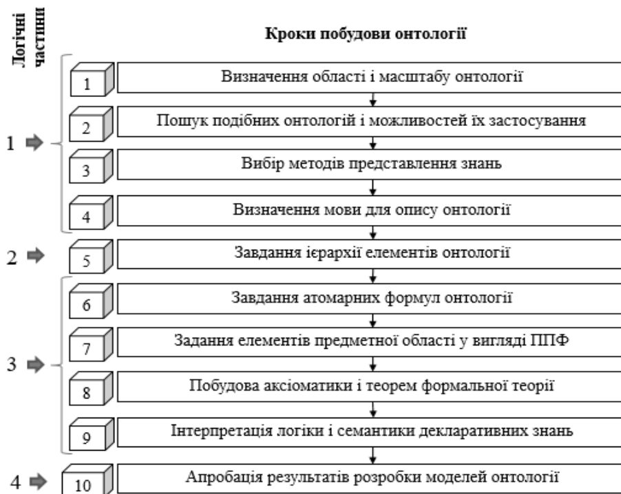
Рис. 1. Послідовність кроків методу побудови онтології декларативних знань багаторівневих систем

В цій роботі увага приділяється 3 логічній частині.