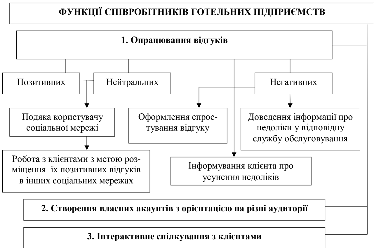
Рисунок 4.1 – Основні завдання персоналу відділу маркетингу і реклами готельного підприємства в соціальних мережах