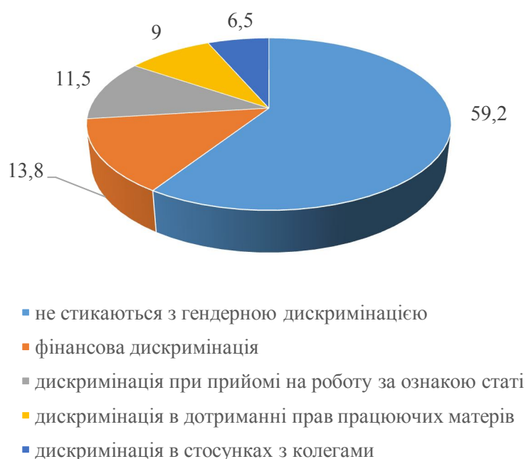
Рис. 1. Розподіл випадків дискримінації, з якими стикаються українки на робочому місці, %

На тлі випадків дискримінації жінок у сфері праці один з провідних сайтів з пошуку роботи Work.ua провів дослідження серед користувачок свого ресурсу. З отриманих результатів стало відомо, з якою дискримінацією українки стикаються на робочому місці (рисунок 1).