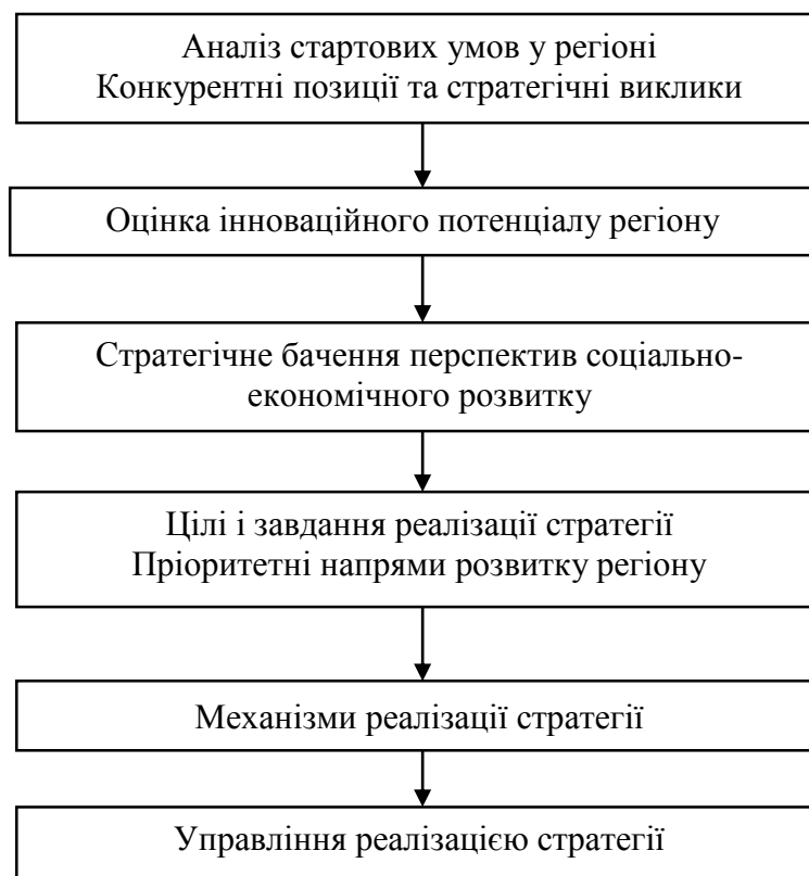
Рис.2. Структура інноваційної стратегії регіону*

На основі цілей інноваційного розвитку регіону, доцільним є формування структури інноваційної стратегії регіону (рис.2.).