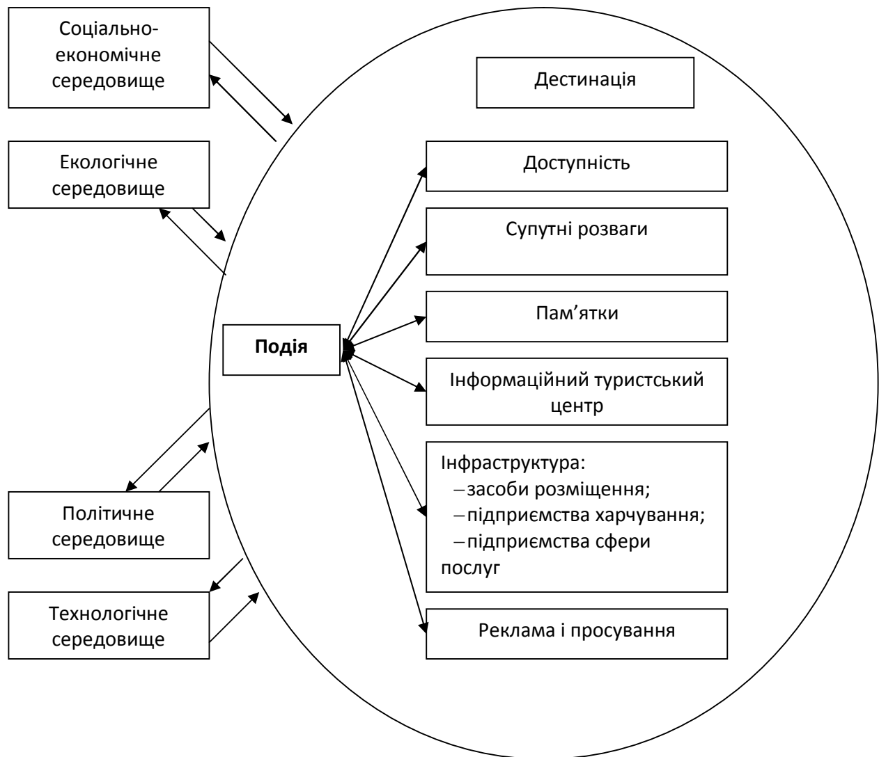
Рис. 2 – Комплексний підхід до формування дестинації подієвого туризму

Подієвий туризм виконує такі функції: формує позитивний імідж регіону, привертає туристів, сприяє розвитку інфраструктури та реновації (відновленню) міського середовища, стимулює збільшення витрат туристів; сприяє збільшенню зайнятості населення у сферах розміщення, харчування, транспорту, відпочинку і розваг, виробництва супутніх товарів та послуг і деяких інших галузях, унаслідок чого збільшується прибуток і відбувається зростання добробуту регіону [49].