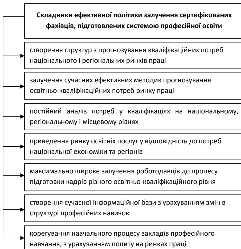
Рис. 1 — Складники ефективної політики залучення сертифікованих фахівців, підготовлених системою професійної освіти

Ефективна політика забезпечення затребуваності підготовлених системою професійної освіти і навчання фахівців на ринку праці вимагає вирішення низки головних завдань, які узагальнено на рисунку 1.