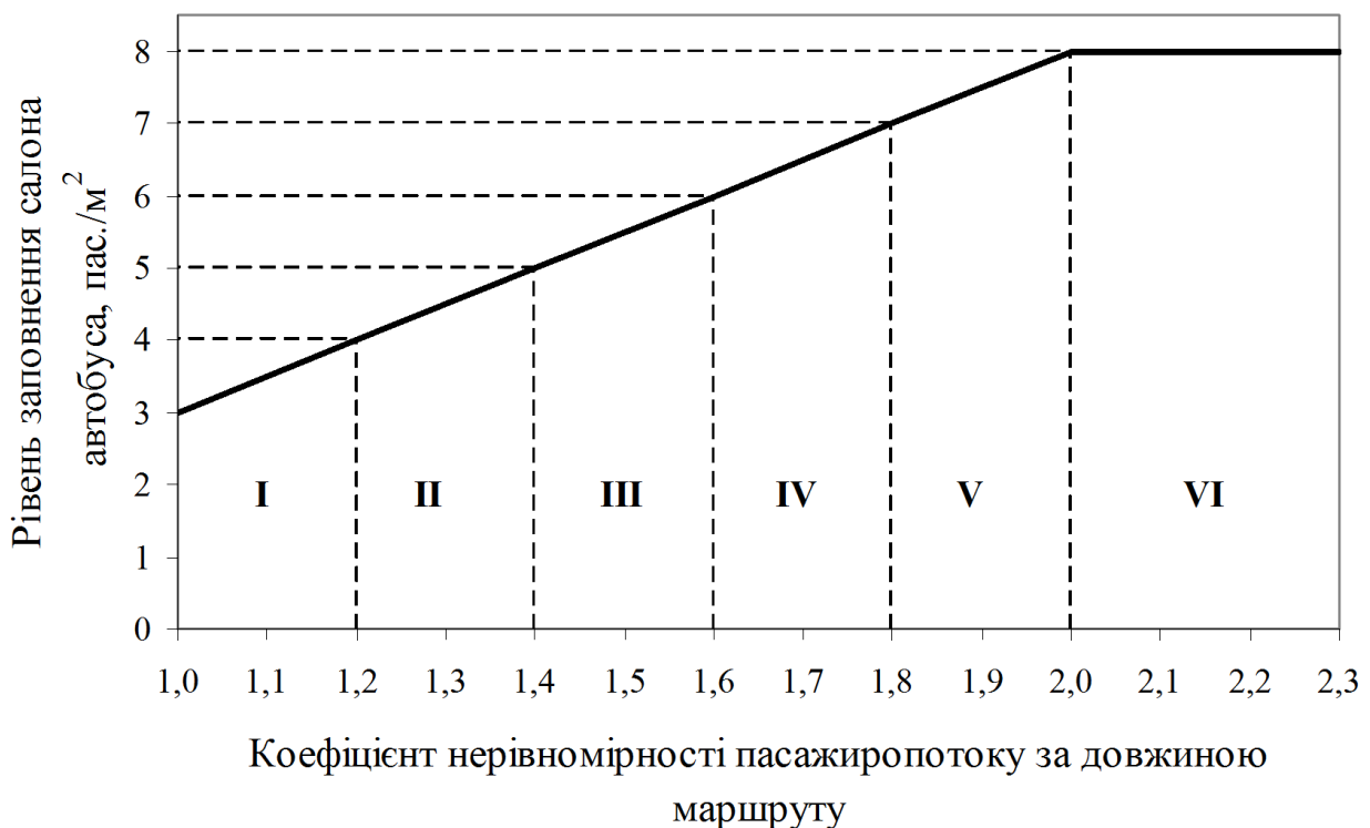
Рис. 2. Графік раціональних рівнів заповнення автобусів на міських маршрутах