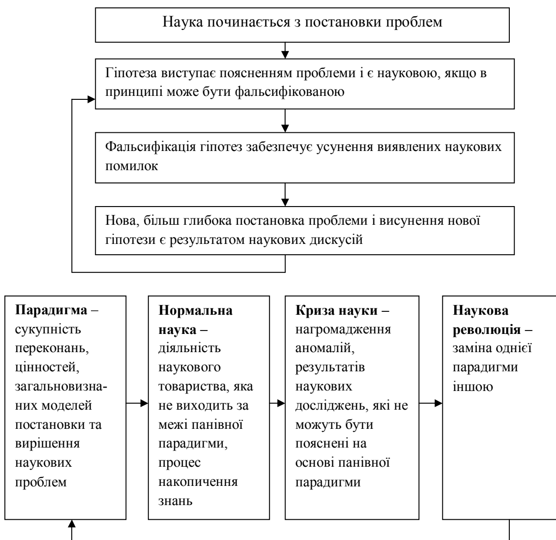
Рисунок 8.2 – Модель «наукових революцій»

Модель «наукових революцій» американського історика, філософа науки Томаса Куна (1922–1995) знайшла відображення у відомій праці вченого «Структура наукових революцій» (1962). Згідно з цією моделлю історичні етапи розвитку наукового знання виокремлюються на основі дослідження процесу зміни наукових парадигм (рис. 8.2).