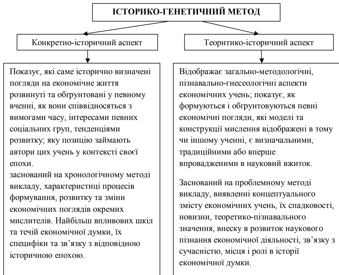
Рисунок 9.1 – Історико-генетичний метод дослідження

роду системи досліджуються в рамках системного підходу, в основі якого лежить розкриття цілісності об'єкта, виявлення різноманітних зв'язків в ньому і зведення їх в єдину теоретичну картину.