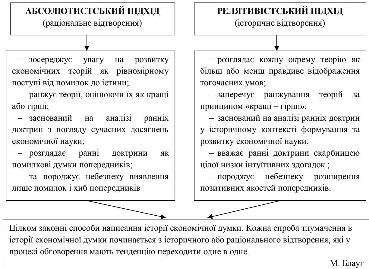
Рисунок 8. 3 – Абсолютистський та релятивістський підходи аналізу

істини, і нині впливова теорія не обов'язково у всіх відношеннях перевищує попередні, які заперечуються в даний момент. З новою теорією як захисним поясом навіть програма досліджень, яка знаходиться в зимовій сплячці, може тріумфально повернутися. Між тим, застарілі ідеї такої програми не будуть відображені в нині домінуючих теоріях; так що можливість такого повернення старих ідей неможливо зрозуміти, вивчаючи лише нові. Ось чому ми повинні вивчати історію економічної думки.