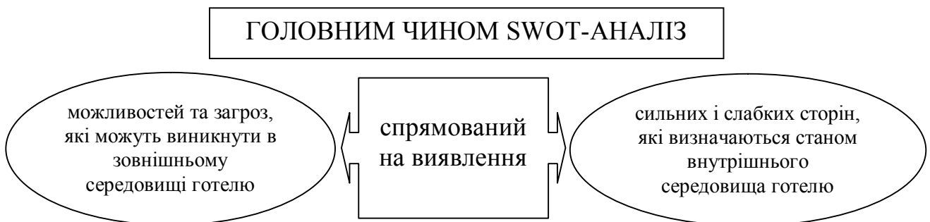
Рис. 2 – Направленість SWOT-аналізу

Досліджуючи зовнішнє середовище, необхідно зосереджувати увагу на з'ясуванні того, які загрози та які можливості вона приховує в собі. Однак, необхідно враховувати та досліджувати середовище не тільки зовнішнє, але й внутрішнє. Це необхідно для того, щоб успішно справлятися із загрозами та дієво використовувати нові можливості, дійсно маючи потенціал для їхньої реалізації. Направленість SWOT-аналізу представимо у вигляді рисунку 2. Результати SWOT-аналізу підприємницької та фінансово-господарської діяльності ПрАТ «Тернопіль-готель» представимо у вигляді рисунку 3.