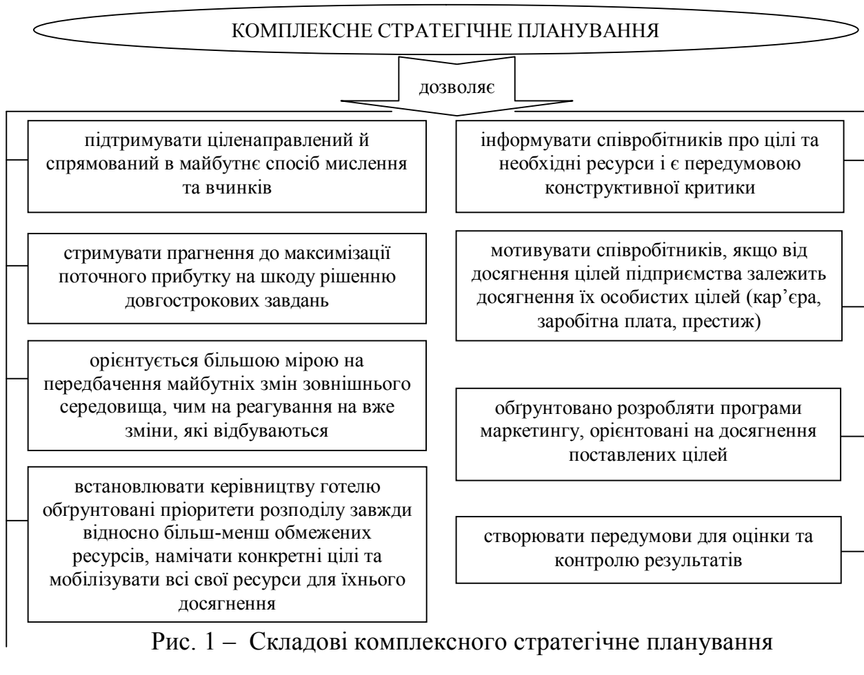
Рис. 1 – Складові комплексного стратегічне планування

В процесі дослідження теоретичних підходів до розробки стратегії розвитку та підприємницької й фінансово-господарської діяльності підприємств готельного бізнесу України наголосимо на тому, що постає питання про необхідність розробки економічної стратегії підприємства, яка дозволить розширити можливості та закріпитися на ринку готельних послуг, який в швидкозмінюваних умовах розвивається. Розробка стратегії розвитку припускає обґрунтування специфічних стратегій, які сприяють досягненню мети підприємств готельного бізнесу на основі підтримання стратегічної відповідності між ними, її потенційними можливостями в області готельного господарства та туризму. Комплексне стратегічне планування має ряд складових, які дозволяють досягти більш ефективного розвитку, при цьому для наочності його представимо у вигляді рисунку 1.