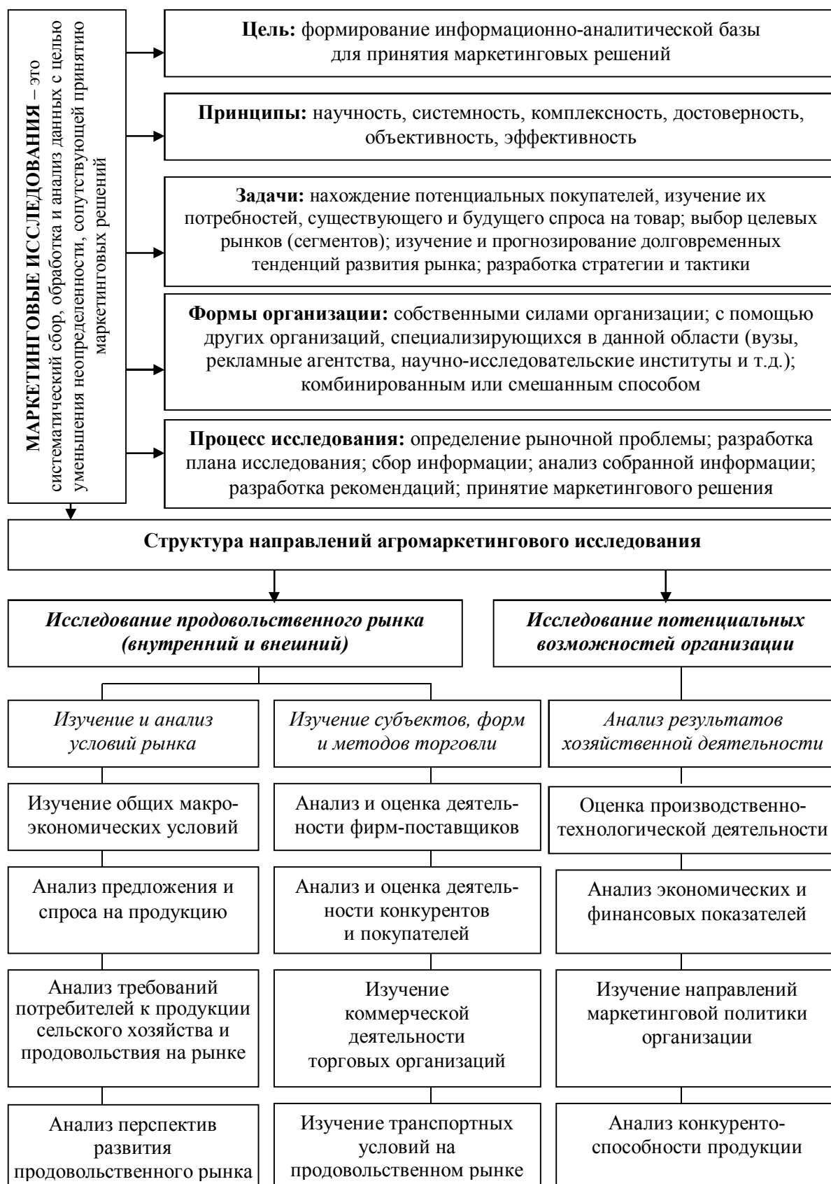
Рисунок 2 – Предлагаемая технология планирования, организации и проведения агромаркетингового исследования

Примечание – Рисунок выполнен автором на основе собственных исследований.