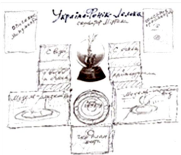
Ескіз проекту «Україна-Фенікс-Лелека»