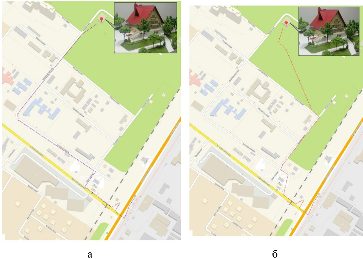
Рис. 1. Схема пішої мобільності за маршрутом «Зупинка громадського транспорту – ARCHOUSE»

Проведені урбаністичні польові дослідження засвідчили, що архітектурно-просторові рішення міської локації ARCHOUSE потребують корекції, а саме: