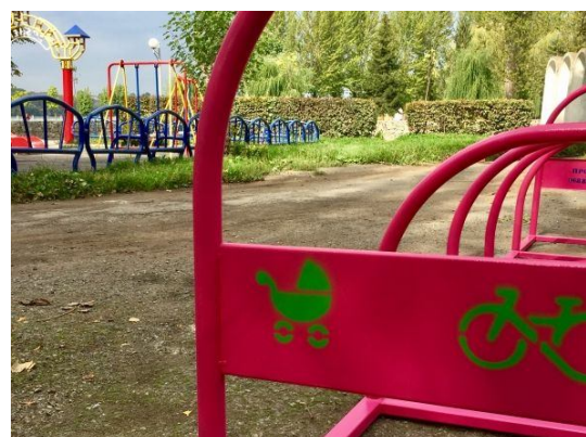
Fig. 2. Gender sensitive elements of complex sporting grounds

1) those which are of interest for girls and women