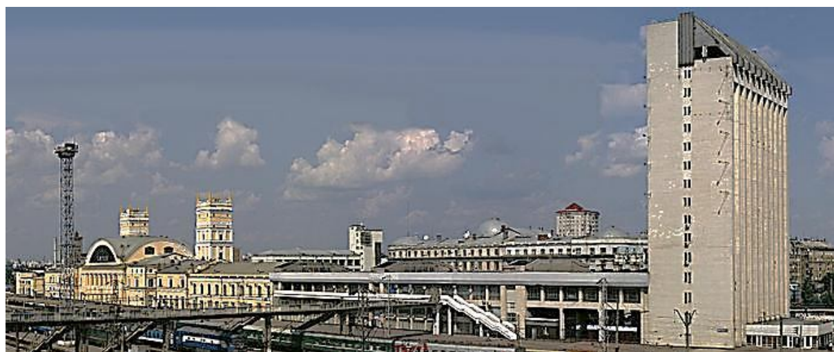
Fig. 2. General view of station complex “Kharkiv-Pasazhyrsky” from the south-west

“Zaliznychnyk” with shops, café, bars and stands; 7 passenger platforms and 2 underpasses for passengers exit; railway station forecourt; car parking.