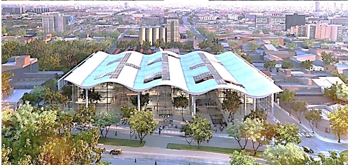
Рисунок 1 – Сіті-хол в м. Буенос-Айрес, Аргентина, арх. бюро Foster+Partners: головний атриум (фото зверху ліворуч), публічний простір під навісом будівлі (фото зверху праворуч), загальний вигляд будівлі (нижнє фото)