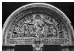
Рисунок 2 – Рельєф на церкві Сен-Мадлен (кожна побудова мала вражаючий та неповторний рельєф)

Вражає розмаїття церков, серед яких неможливо знайти дві однакові (рис.2). Втім, незважаючи на це, на прикладі Німеччини автор хоче представити спільні риси унаслідок національних відмінностей.