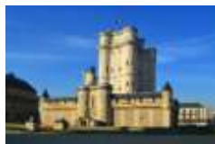
Рисунок 1 – Венсенський замок (побудова на кшталт неприступної фортеці)

Романський період – це час становлення і розвитку в архітектурі західної Європи “романського” стилю. Приблизно за початок романської епохи можна прийняти 11 ст. Кінець романського періоду у Франції припадає на середину 12 ст., проте в інших країнах цей стиль продовжував розвиватися майже ціле сторіччя. Більш усього зберіглося пам’ятників романського періоду у Германії.